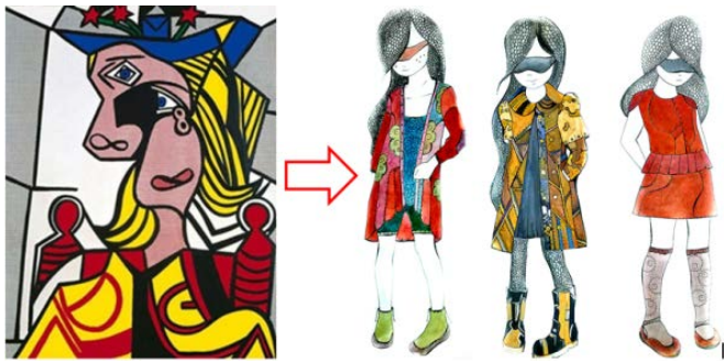
Рис. 3. Прояв інтерпретованих складових елементів картини Джексона Поллока «Жінка в капелюсі з квітами» та її відтворення в колекції «Frank»