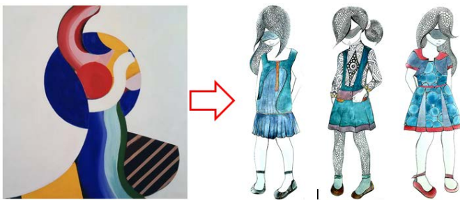
Рис. 4. Прояв інтерпретованих складових елементів картини Говарда Ходжкіна «Містер Ніколас Монро» та її відтворення в колекції «Frank»