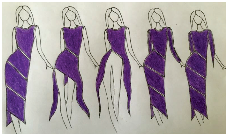
Рисунок 1. Ескіз сукні та її трансформації