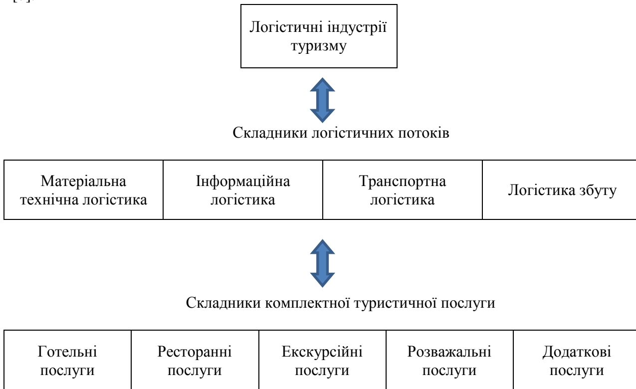
Рисунок 2. Структурні складники логістики індустрії туризму

У загальному визначенні логістика являє собою просування будь-яких потоків – матеріальних, ресурсних, інформаційних, фінансових, людських тощо. Наприклад, логістику матеріально-технічної бази туризму треба розглядати як логістику сфер розміщення туристів (готельних послуг) та харчування (ресторанного господарства). Вона зазвичай ґрунтується на принципі інтеграції й системності, тобто їй притаманний синергетичний ефект, обумовлений взаємодією суб'єктів та об'єктів туристичних послуг [7].