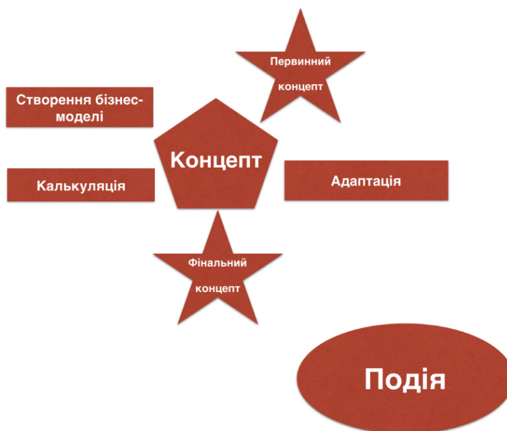
Рис. 6. Макет проектування події [15]

Окрім налагодженого алгоритму впровадження event marketing'у у діяльність компанії, потрібно вміти проектувати події (рис. 6).