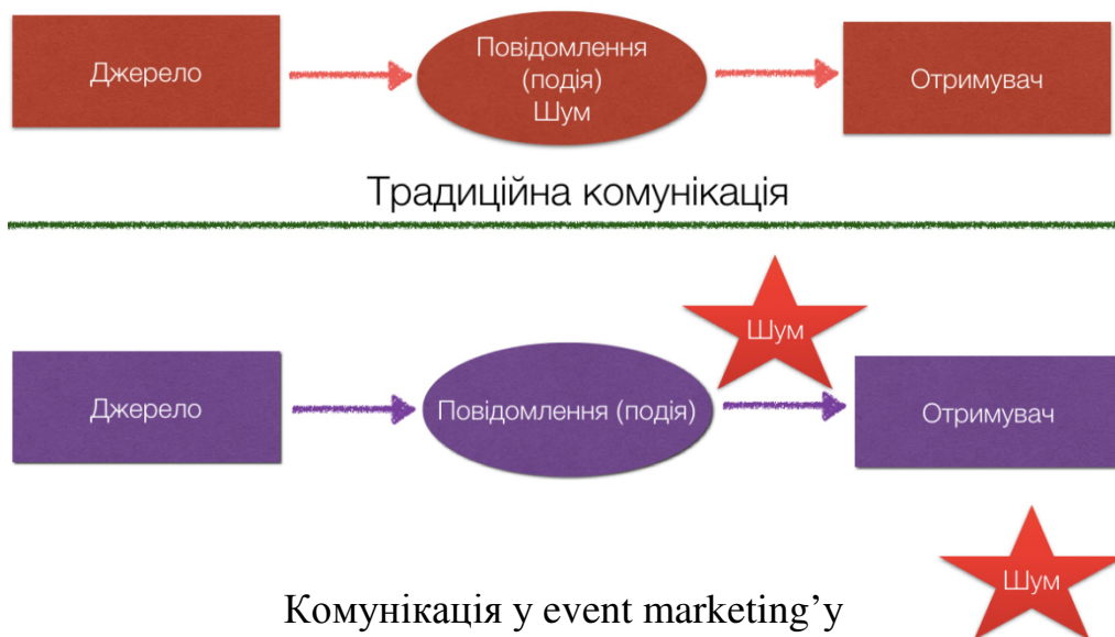
Рис. 5. Комунікаційний ланцюжок традиційного маркетингу та event marketing'у [15]

Event marketing це маркетингова комунікація у чотирьох вимірах. Перший – це емоційний вимір, тобто компанії не «підштовхують» свій товар до споживача, а, навпаки, «притягують» покупців за допомогою налагодження емоційних стосунків. Другий – дотичний вимір, іншими словами споживач може сам визначити цінність продукту. Третій – інтелектуальний вимір, який полягає у проведенні доречної події для визначеної цільової аудиторії. Четвертий – просторовий вимір, він відповідає за реалізацію перших трьох вимірів та інформування гостей про подію.