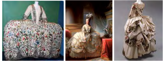
Рис. 1. Костюм епохи рококо

виключення, від придворних дам до простих робітниць (рис. 1.) [1].