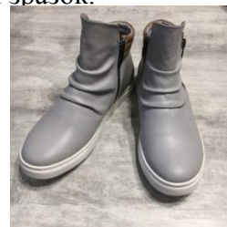
Рисунок 3 – Зразок виготовленого взуття з врахуванням корегування

Висновки. В результаті проведеного аналізу основних тенденцій моди сезону 2017-2018р. було узагальнено класифікацію способів декорування взуття. Розглянуто способи технологічного виконання власного декору. Розроблено та виготовлено конструкцію жіночого взуття з власним декоруванням та встановлено припуски на корегування заготовки в залежності від висоти каблука, що є важливим для масового виробництва.