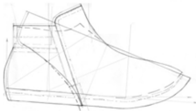
Рисунок 2 –Корегування ґрунд-моделі зі складками на підйомі стопи

В ході дослідження було проведено аналіз різних конструкцій взуття з защіпами, різного способу технологічного виконання, складок різної ширини на підйомі стопи. Дослідження показало залежність припусків на корегування від форми носкової частини взуття, висоти каблука, різних матеріалів. Спроектована модель жіночих черевиків за італійською методикою зі складками на підйомі стопи на різну висоту каблука показала експериментальним шляхом необхідність корегування крила ґрунд моделі союзки в нижній частині на 5-10 мм. На рис. 2 та 3 наведено креслення спроектованої ґрунд моделі з корегуванням та виготовлений зразок.