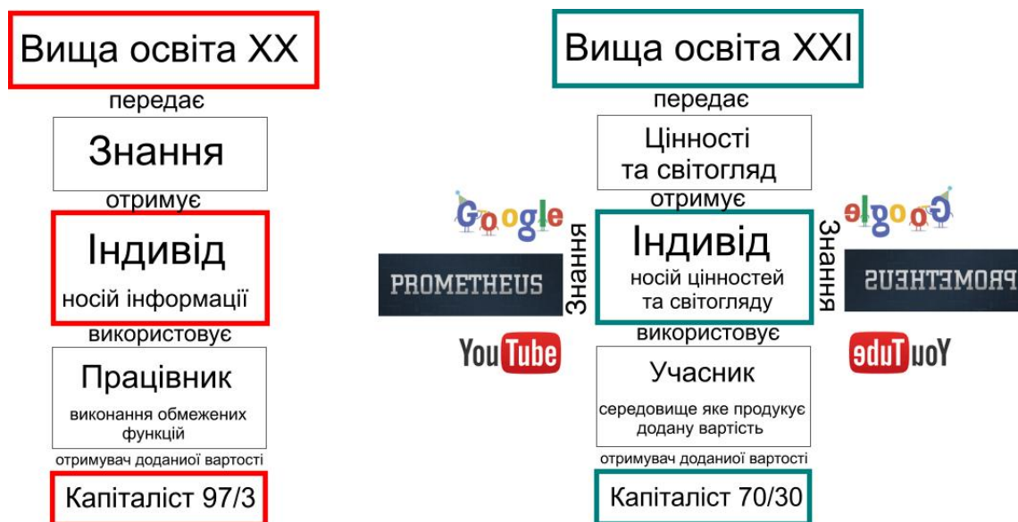
Рисунок 2 – Схематичне зображення суті систем освіти сучасного та майбутнього.

Сучасна система освіти програмує наше суспільство на надзвичайно критичні показники розподілу капіталу а саме співвідношення 97/3, у країнах із сучасними освітніми програмами розподіл капіталу прямує до співвідношення 70/30, основна відмінність систем освіти надана на рисунку 1.