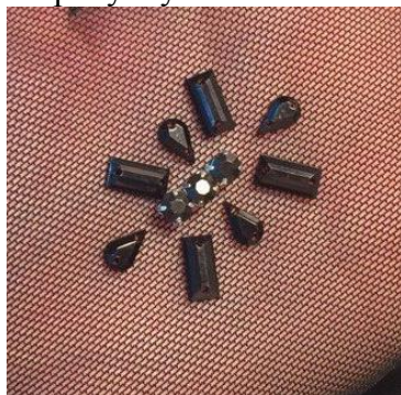
Рисунок 2 – Приклад виконання вишивки на тканині

Оздоблення на тканині, виконувались повністю вручну. Один із прикладів виконання вишивки представлено на рисунку 2.