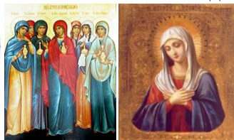
Рисунок 4 – Великий палантин православних жінок Давньої Русі домонгольського періода

Для визначення вимог до орнаментального принта хустки з релігійним спрямуванням було проведено інформаційно-графічний аналіз церковних атрибутів та облачення священнослужителів, який показав, що основними ознаками релігійних мотивів є застосування орнаменту певних видів з характерною кольоровою гамою, а також те, що в основі існуючого християнського релігійного орнаменту покладено візантійські візерунки, які останні роки є основою принтів провідних домов моди світу. Тому у якості вихідних параметрів орнаменту для розробки орнаментального принта покладено центричний вид симетрії, з використанням основних геометричних фігур кола та квадрата, використання схеми хреста у центрі композиції (рис. 5). Як інформаційне джерело: архітектура, аксесуари, олтарі, купола, ікони, розети з центричним орнаментом за принципом «калейдоскоп», комбінований вид орнаменту для побудови композиції.