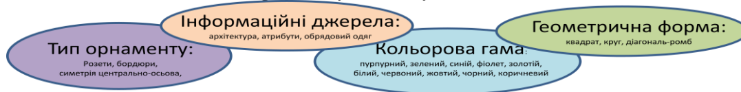
Рисунок 5 – Вимоги до орнаментальних принтів релігійного спрямування

Для визначення вимог до орнаментального принта хустки з релігійним спрямуванням було проведено інформаційно-графічний аналіз церковних атрибутів та облачення священнослужителів, який показав, що основними ознаками релігійних мотивів є застосування орнаменту певних видів з характерною кольоровою гамою, а також те, що в основі існуючого християнського релігійного орнаменту покладено візантійські візерунки, які останні роки є основою принтів провідних домов моди світу. Тому у якості вихідних параметрів орнаменту для розробки орнаментального принта покладено центричний вид симетрії, з використанням основних геометричних фігур кола та квадрата, використання схеми хреста у центрі композиції (рис. 5). Як інформаційне джерело: архітектура, аксесуари, олтарі, купола, ікони, розети з центричним орнаментом за принципом «калейдоскоп», комбінований вид орнаменту для побудови композиції.