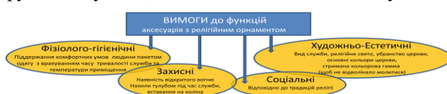
Рисунок 1 – Вимоги до аксесуарів з оздобленням

Результати дослідження. Як відомо, сучасний одяг поділяється на різні класи та підкласи, які визначаються різними факторами, де найвагомим є за призначенням. Відомо, що в Україні велика частина населення є прихожанами церкви. Особлива увага зі сторони церкви приділяється зовнішньому вигляду прихожан для відвідування церкви, серед яких є застосування одягу, що максимально вкриває тіло людини, не містить відволікаючих елементів та ергономічне для проведення обрядових рухів. Але у будь-якому варіанті одягу основним елементом костюму жінок прихожан є застосування в своєму оздоблених головних уборів – хустки/ шалі/палантина тощо. На основі цього розроблено основні вимоги до аксесуарів християнських прихожан (рис. 1) та вимоги до функцій хустки, як обов'язкового елемента костюму жінок прихожан (рис. 2).