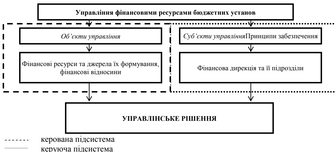
Рис. 2. Управління фінансовими ресурсами бюджетних організацій на засадах системного підходу [власна розробка]

Структуру системи управління фінансовими ресурсами бюджетних організацій наведено на рис. 2.