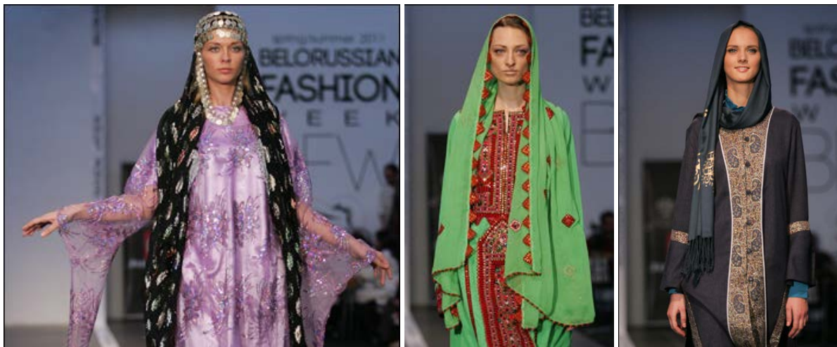
Рис. 3. Модель сучасної жіночої блузи за мотивами національних сорочок Ірану.

1 б. Туркмени 1 г. Південне Узбережжя Порт