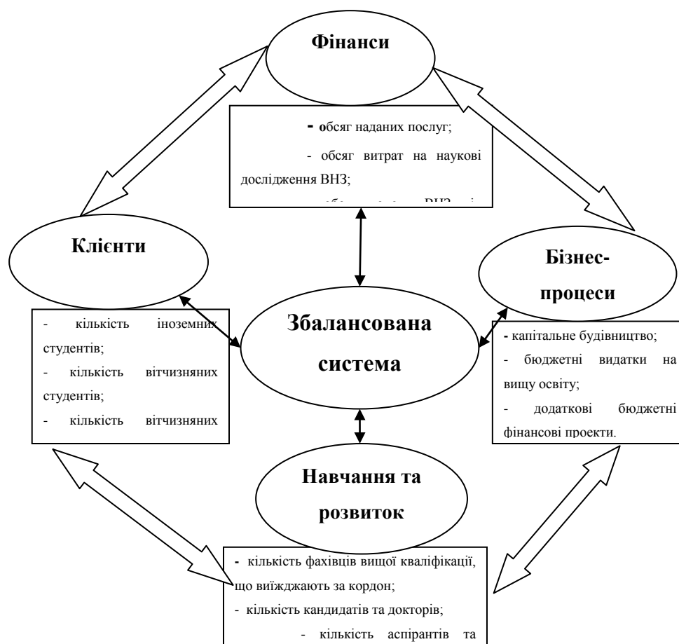
Рис. 1. Адаптована збалансована система показників для оцінки ринку освітніх послуг (розроблено автором)

У адаптованій ЗСП залишаються чотири ключові складові: фінанси, клієнти, бізнес-процеси й навчання та розвиток персоналу. Але кожен складову повинні визначати відповідні показники (рис. 1).