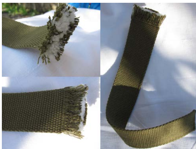
Рис.1. Досліджуваний текстильний строп

Методологія досліджень. Об'єкт дослідження: текстильний строп з втраченою нормативно-технічною документацією (див. рис.1).