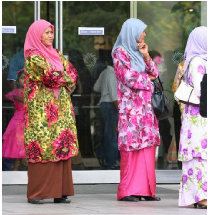
Рис. 2. Малазийский костюм