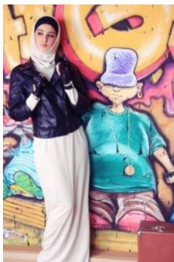
Рис. 6. Захра Лари – мусульманская фигуристка