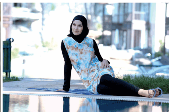
Рис. 4. Мусульманский купальник