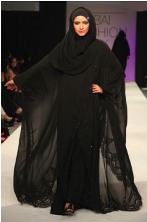
Рис.1. Арабская абайя

свой тюрбан Хайруниса Гюль, жена нынешнего турецкого президента. Последним же пискom моды в Турции считается исламский купальник – буркини (рис. 4). Еще несколько лет назад, женщины не могли позволить себе купание на пляже или в бассейне, не нарушив законов хиджаба. Теперь же при купании мусульманки полностью закрывают тело, кроме лица, ладоней и стоп. Состоит купальник, как правило, из двух вещей – свободного топа с рукавами и капюшоном длиной почти до коленей, и брюк, узких или широких, с особыми петлями в районе бедер, которыми они крепятся к топу, предотвращая раскрытие тела.