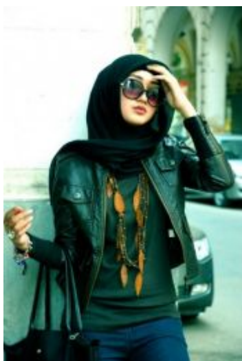
Рис. 5. Мусульманка Европы

разительно отличается. В этой стране, единственной из стран Европейского Союза, еще в 2005 году был принят закон о запрете ношения любой религиозной символики в государственных учреждениях. Причем распространяется этот закон и на учениц школ и высших учебных заведений. Этот закон вызвал волну массовых волнений и протестов, которые не утихают и спустя десять лет – навязывание личной культуры не привело ни к чему хорошему. Платок как «символ угнетенности женщины» ни срывать, ни одевать насильно не нужно. Не лучше ли спросить у самих женщин?