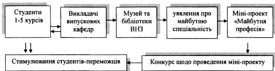
Рис. 3 Зразок моделі творчого міні-проекту

В період вивчення навчальних дисциплін «Вступ до фаху» або «Університетська освіта» виникає необхідність колективної підготовки нового проекту щодо спеціальності (рис.3):