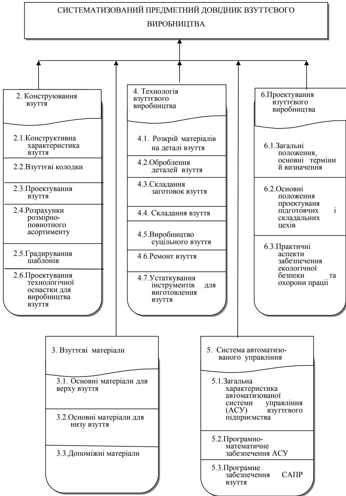
Рис. 2. Інформаційні блоки систематизованого предметного довідника взуттєвого виробництва