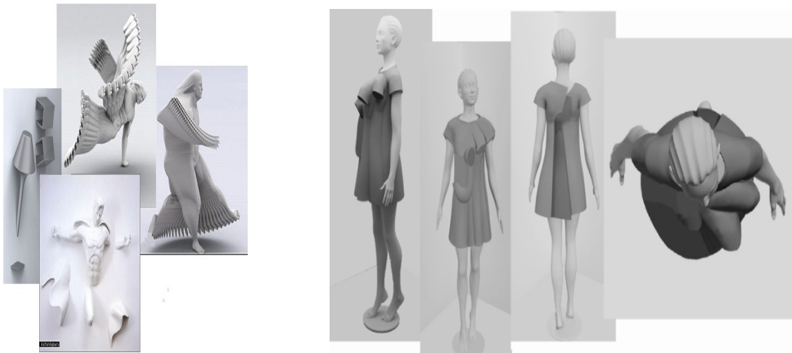
Рис. 3. Нові форми сучасного одягу з використанням елементів сучасного мистецтва

Через складність форми, з метою кращого розуміння побудови та розміщення окремих деталей костюму, було розроблено ескізи об'ємно-просторової форми моделей, які виконано в сучасній-дизайн програмі 3D Max. Результат нових форм сучасного одягу з використанням сучасного мистецтва, на прикладі однієї моделі, наведено на рис. 3.