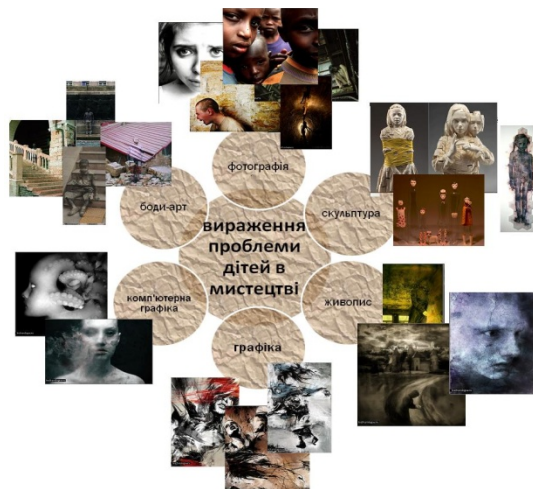
Рис. 3. Витвори мистецтв досвідчених дизайнерів-художників

За основу творчої концепції взято гостру соціальну проблему всього Світу - проблему дитячої безпритульності. Цей феномен не може залишати байдужим жодного свідомого громадянина України (рис. 3), оскільки у фізичній та моральній занедбаності дітей криється джерело небезпеки для розвитку культури, майбутнього здоров'я народу та його моральності. Основна мета розробки перспективної соціальної колекції - спровокувати інтелектуальну співучасть глядача, розбудити свідомість буденності, пропонуючи радикально новий досвід осмислення світу.