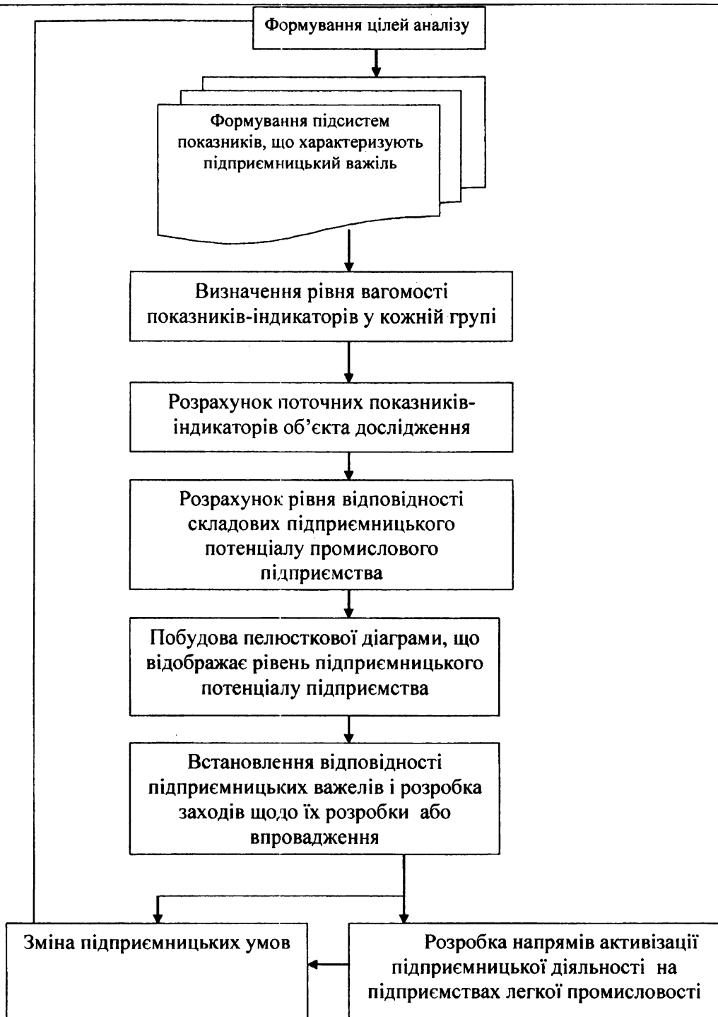
Рис. 1. Структурна схема методичних засад оцінювання рівня підприємницького потенціалу підприємств легкої промисловості

Таким чином, отримано підсистеми підприємницького потенціалу, що представлено на рис. 2.