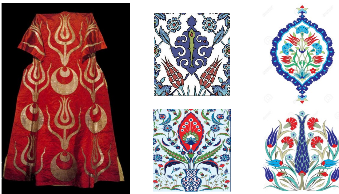
Рис. 5. Орнаментальные мотивы в традиционном турецком мужском костюме

культурам, а в мусульманській культурі його ще називали «слезой Аллаха», що сближало кипарис з «бутой» («восточним огурцом»), а також архетиповим мотивом «древа життя». Таким образом, можно утверждать, что в турецкой культуре нет четкого разделения на мужские и женские орнаменты, а важен символический контекст и композиционное оформление. Гвоздика, например, – символ счастья и мудрости, но, по местной традиции, может быть использована в костюме пожилой женщины (рис. 6).