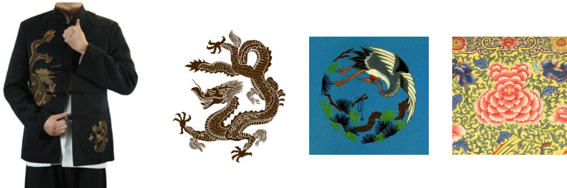
Рис. 4. Традиционные мужские орнаменты в китайском costume: дракон, журавль, пион

Гендерный код в орнаменте турецкого костюма несколько сложнее. Важен не столько мотив, сколько его оформление – композиционное и стилистическое. На рис. 5 изображены вариации мотива «мандалы», которая интерпретируется как модель вселенной. Родиной мандалы считается Тибет, но со временем она распространилась и в других странах. Приемы изображения могли быть изменены, а смысл был чрезвычайно разнообразен. В современной турецкой орнаментике мандала является символом совершенства и оберегом, с помощью которого достигается очищение разума и познание мира [4]. Орнамент в виде мандалы или медальона характерен для мужского костюма. Турецкая мандала может включать традиционные турецкие мотивы: тюльпаны, кипарисы, гвоздики. В турецком costume мотив тюльпана появился в XVI века, когда именно в Турции впервые «окультуривали» этот цветок. Позже мотив тюльпана стал символом Османской Турции (кафтан на рис. 5). Кипарис – очень многозначный символ. Скорее мужской, чем женский, он означал стойкость и силу. Из-за формы кроны, напоминающей язык пламени, кипарис издавна был