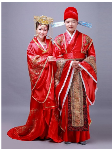
Рис. 1. Традиционный китайский костюм

первый и поверхностный взгляд, в национальном костюме отсутствуют привычные для европейца гендерные различия. В китайском костюме халат являлся универсальной одеждой для мужчин и женщин всех сословий и во все времена. Он даже запахивался для обоих полов одинаково – слева направо, запах в другую сторону считался варварством (рис. 1). Схожесть турецких костюмов, мужского и женского, объясняется наличием штанов как обязательного элемента ансамбля для всех. Это впечатление усиливается присутствием почти идентичных кафтанов и жилетов, а также обильной и, как поначалу кажется, одинаковой, орнаментикой (рис. 2).