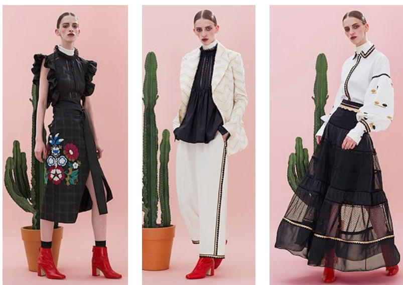
Рис. 9. Lug Von Siga

Орнамент и декор позволяют любой костюм репрезентовать с позиций гендера. Геометризованный по типу основного элемента стилизации и фризный по композиции орнамент более характерен для мужской одежды. Растительный мотив, трактованный натуралистично или декоративно, расположенный в костюме ассиметрично, – это приемлемо, в большей мере, для женского костюма. Но женщины в скорее, чем мужчины, склонны подчеркивать свою природную привлекательность при помощи костюма, поэтому дизайнеры дают возможность модницам привносить в свою одежду багаж особых сексуальных смыслов, неотделимых от укорененного в турецкой культуре представления о женственности (рис. 9). Учитывая, что гендерные различия в мировой моде сегодня претерпевают значительные изменения, а актуальные тренды способствуют размытию гендера, турецкая мода вносит в костюмный дизайн последних сезонов некую неопределенность в духе «унисекс» (рис. 8).