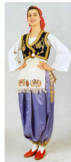
Рис. 2. Традиционный турецкий костюм

При более пристальном рассмотрении обнаруживается, что для визуализации гендерной принадлежности мастера Востока использовали, прежде всего, богатую и разнообразную орнаментку [2]. В китайской традиции существовали, например, достаточно четкие регламентации относительно «женских» мотивов – это феникс, хризантема и ива (рис. 3).