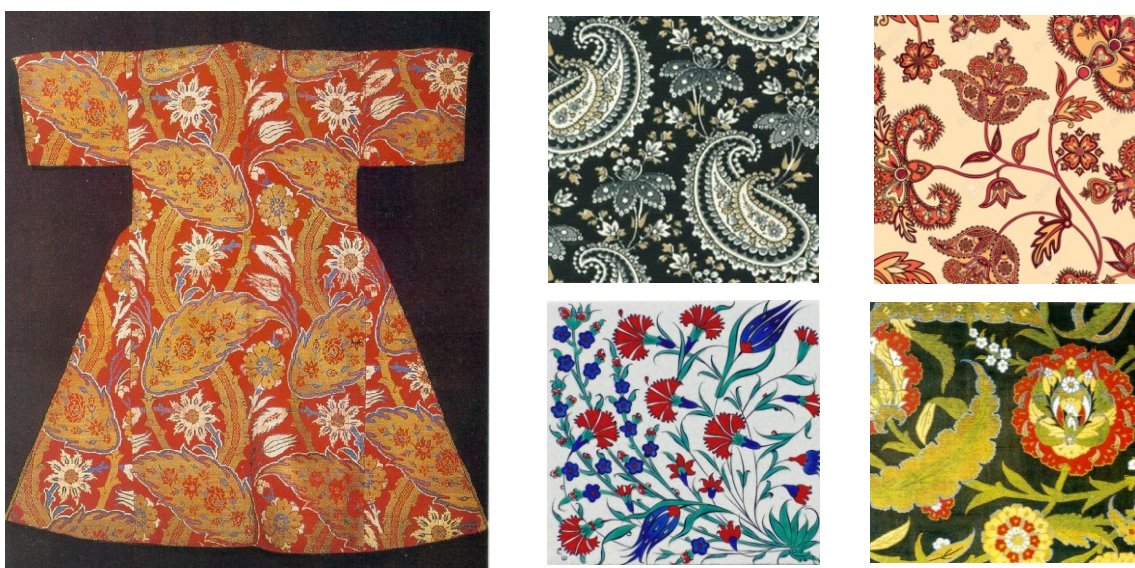
Рис. 6. Орнаментальные мотивы в традиционном турецком женском костюме