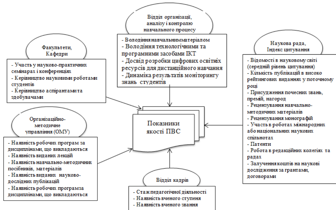
Рис. 2 Способи автоматичного збору показників якості ПВС в ДО

На рис. 2 згруповані показники якості ПВС при ДО за шляхами отримання інформації.