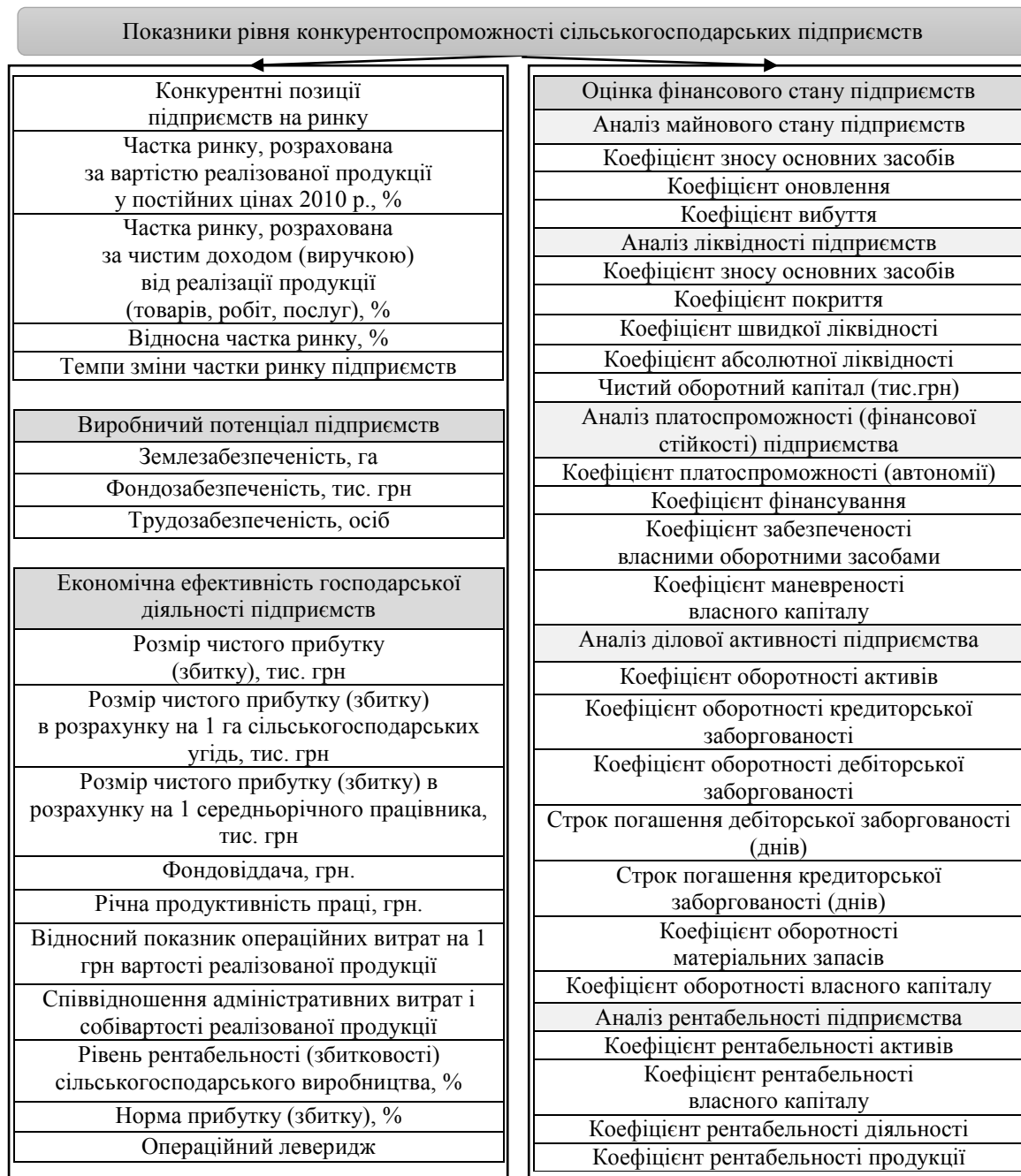
Рис. 1. Комплексна система показників основних аспектів діяльності сільськогосподарських підприємств із різною спеціалізацією

Основними критеріями вибору оціночних показників були: об'єктивність, комплексність, співставність, врахування специфічних особливостей діяльності та різної спеціалізації сільськогосподарських підприємств району.