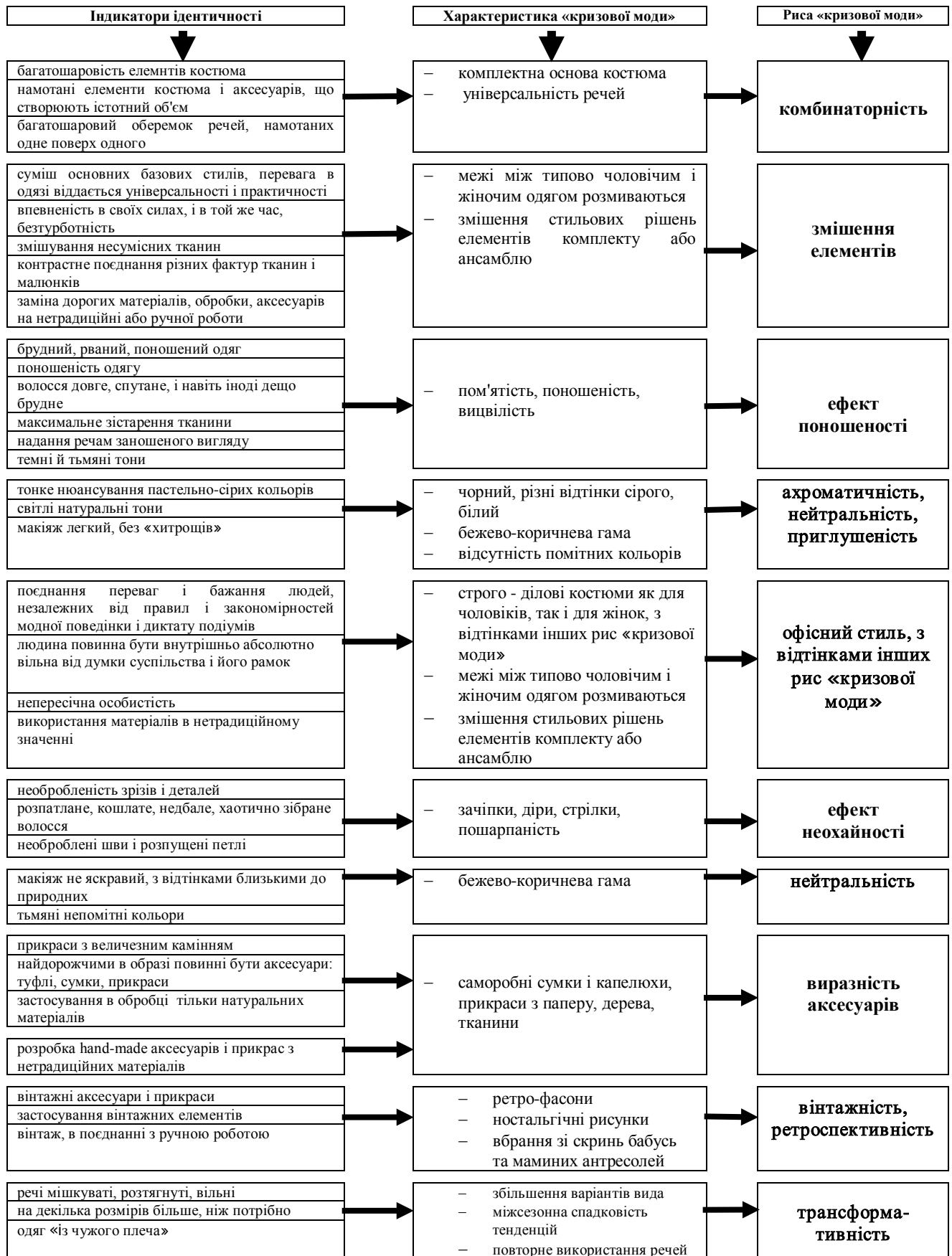
Рис. 2. Фіксація найбільш стійких ознак формування проектного образу споживача при розробці модних образів в контексті так званої «кризової моди»