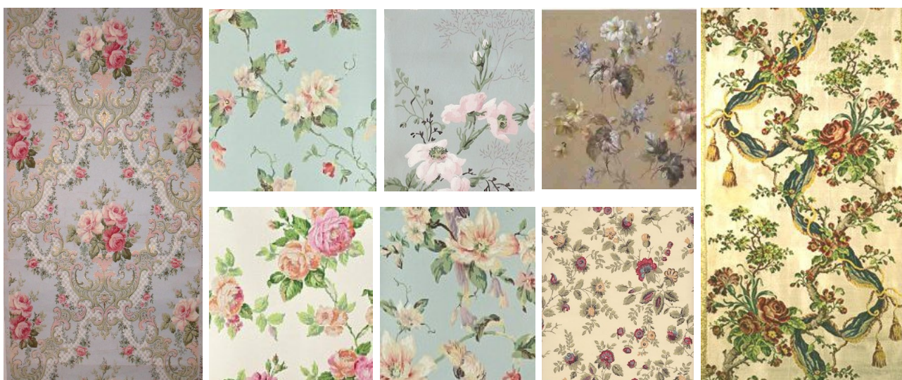
Рис. 3. Зразки флористичних елементів орнаменту

Орнамент текстильних виробів стилю «романтизм» має певні особливості композиційного розташування елементів на площині рисунку. Для романтизму характерно використання рапортного розташування малюнка на площині. В декоративних тканинах для оформлення інтер'єру широко поширена рівність площ малюнка і фону, оскільки вона надає композиції врівноваженості, монументальності, простоти та легкості сприйняття, що посилюється симетричною побудовою малюнка, оскільки в таких тканинах переважає статичне рішення всередині рапортної сітки [2: 156; 6: 71]. Існують різноманітні варіації орнаменту, тож варто виділити найбільш вживані орнаментальні сітки та визначити їх як рекомендовані. Зокрема, часто зустрічається орнамент, що представляє собою чергування більших та менших елементів, які розташовані на однаковій відстані (рис. 4а). Також використовується орнамент, який являє со-