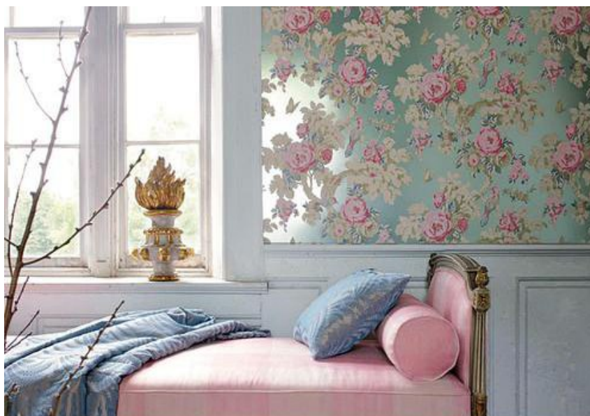
Рис. 1. Інтер'єрні рішення в стилі «романтизм»