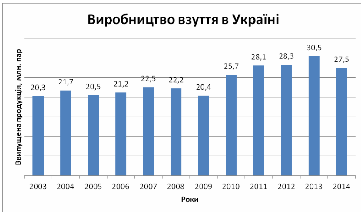
Рис. 1. Динаміка обсягів виробництва шкіряного взуття в Україні за 2003–2014 роки, млн. пар

Аналіз експортно-імпортних операцій показав, що обсяги імпорту взуття в Україну значно перевищують обсяги експорту взуття вітчизняного виробництва (рис. 2) [3]. Безперечним лідером імпорту є Китай (> 50 %), а експорту – Італія (див. таблицю).