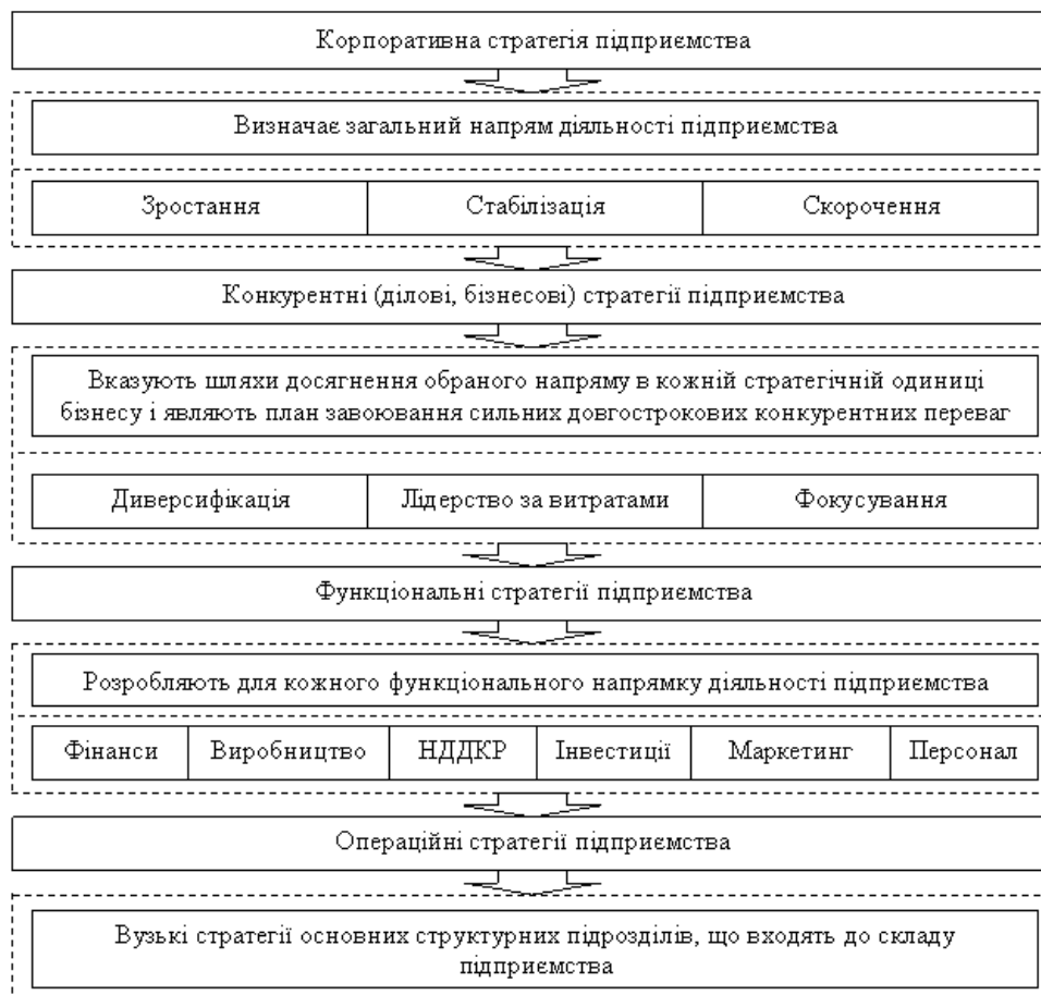
Рис. 1. Ієрархія стратегій підприємства як виробничо-господарської системи

Графічне зображення ієрархії стратегій підприємства як виробничо-господарської системи представлено на рис. 1.