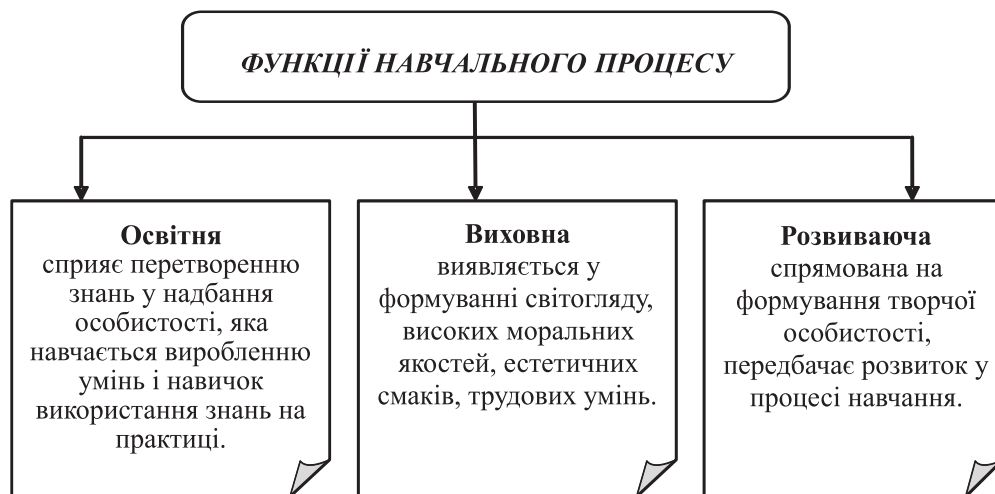
Рис. 2. Функції навчального процесу в системі якості освіти

Таким чином, навчальний процес як складова частина загального виховання всебічно розвиненої сучасної особистості повинен забезпечити виконання пізнавального завдання реалізацією трьох функцій, основними з яких є освітня, виховна і розвиваюча (рис. 2).