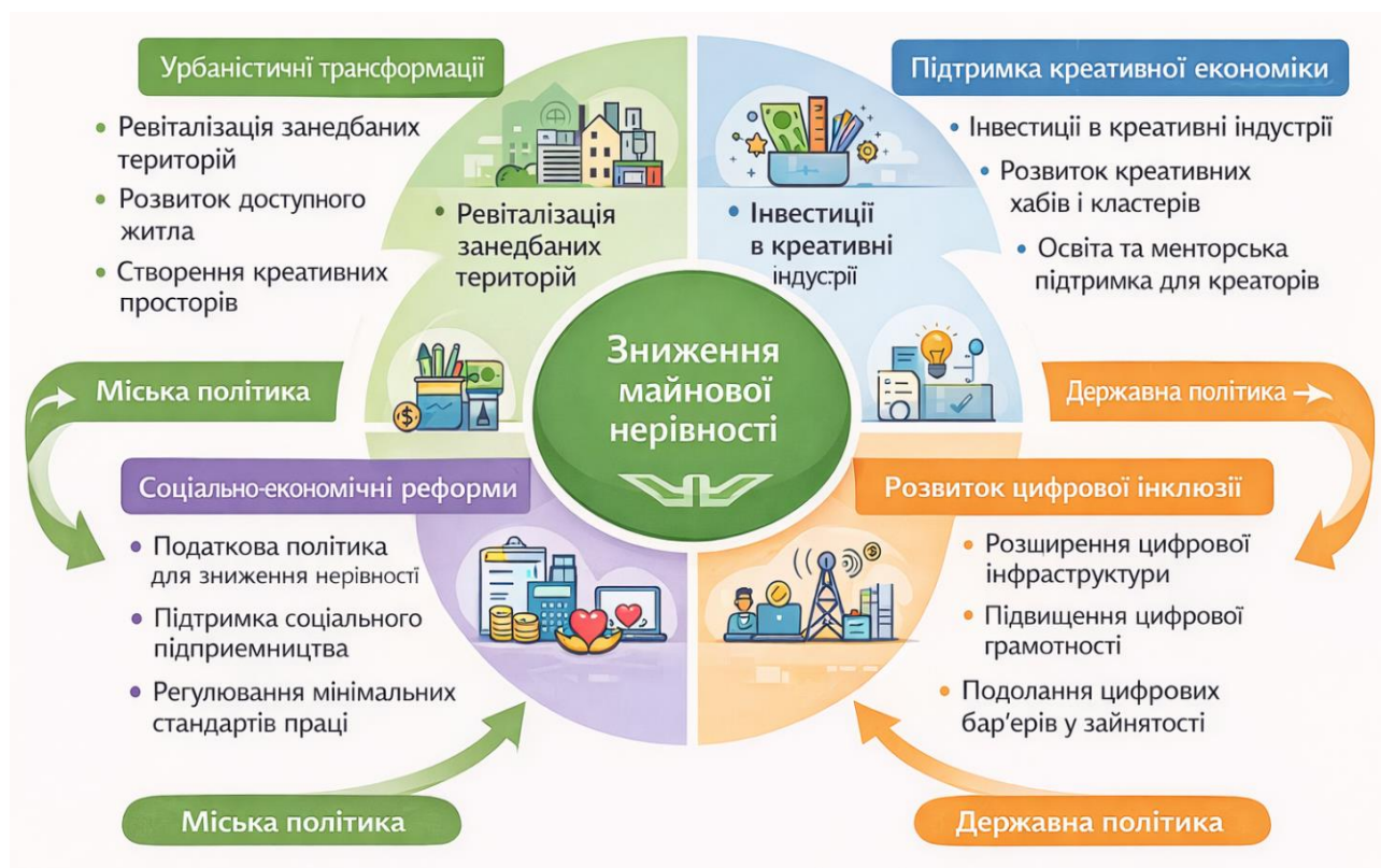
Рис. 4. Інструменти подолання майнової нерівності в урбанізованій цифровій економіці