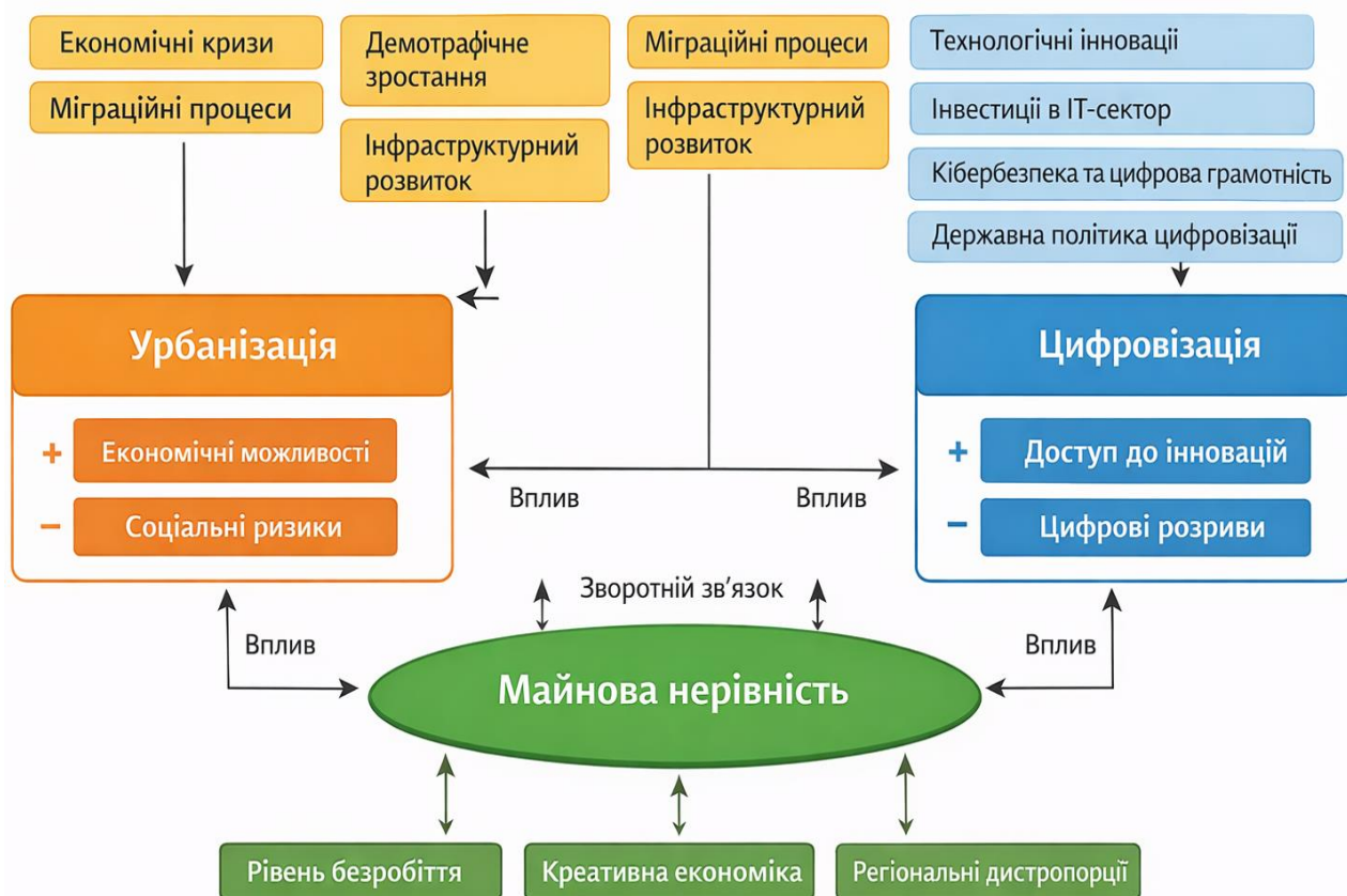
Рис. 3. Інтегрована модель взаємодії урбанізації, цифровізації та майнової нерівності