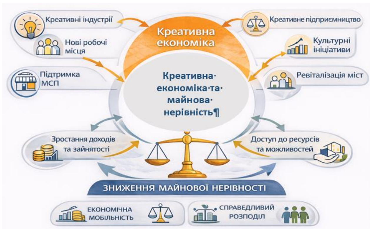
Рис. 5. Креативна економіка як механізм подолання майнової нерівності