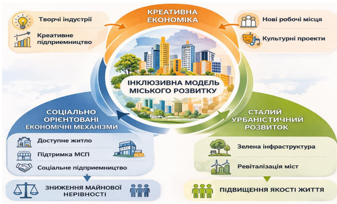
Рис. 1. Інклюзивна модель міського розвитку

культурних та інноваційних кластерів, створення умов для креативного підприємництва. Наступним етапом виступає запровадження соціально орієнтованих економічних механізмів, які забезпечують рівний доступ населення до економічних можливостей. Завершальним етапом є інтеграція зазначених підходів у єдину систему управління міським розвитком, що передбачає взаємодію органів місцевого самоврядування, бізнесу, креативних спільнот та громадянського суспільства. Така інтеграція дозволяє сформувати комплексну модель розвитку міських територій, орієнтовану на соціальну справедливість, економічну ефективність та довгострокову стійкість. У результаті реалізації зазначених підходів формується інклюзивна модель міського розвитку, яка поєднує інноваційний потенціал креативної економіки, соціальну орієнтацію економічних механізмів та принципи сталого урбаністичного розвитку, що створює передумови для зниження майнової нерівності та підвищення якості життя населення (рис. 1).