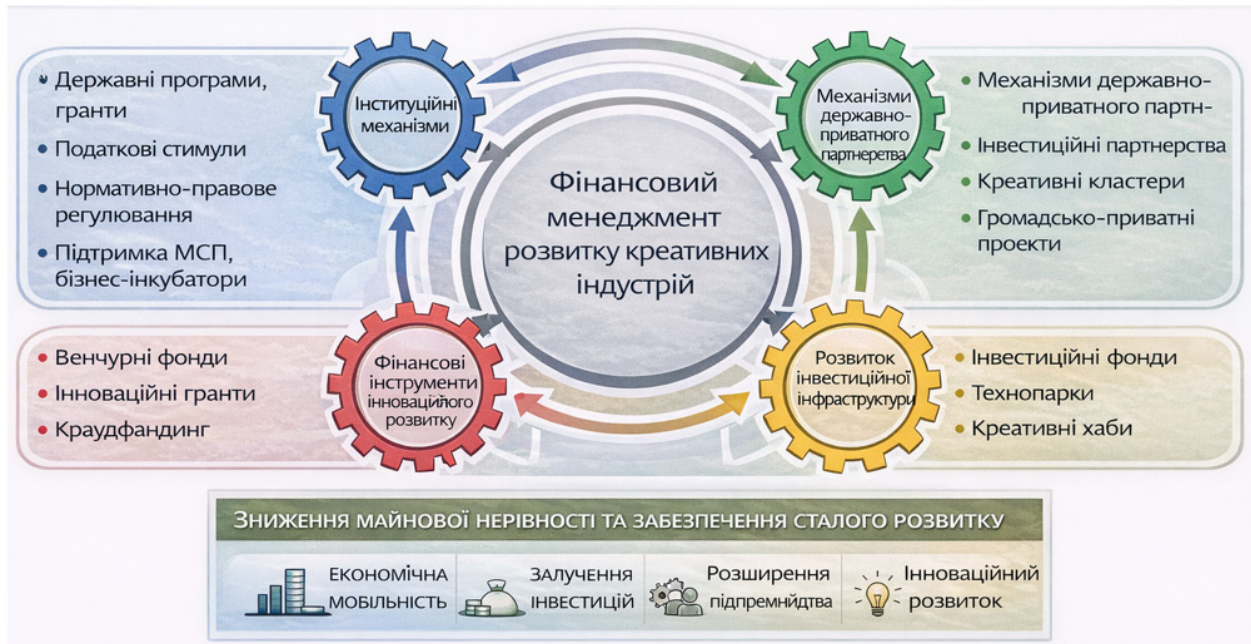
Рис. 2. Інтеграційно-трансформаційний механізм фінансового менеджменту розвитку креативних індустрій

Реалізація інтеграційно-трансформаційного механізму фінансового менеджменту розвитку креативних індустрій сприяє подоланню майнової нерівності та забезпеченню сталого розвитку через формування нової моделі розподілу економічних ресурсів, заснованої на інноваціях, людському капіталі та інтелектуальній діяльності. У межах такого механізму поєднуються інституційні, фінансові та інноваційні інструменти підтримки креативного сектору, зокрема державні програми стимулювання творчого підприємництва, грантові та інвестиційні фонди, механізми державно-приватного партнерства, цифрові фінансові платформи та інструменти підтримки малого і середнього бізнесу, що дозволяє розширити доступ населення до фінансових ресурсів і можливостей підприємницької діяльності, зменшити бар'єри входу на ринок та активізувати розвиток локальних економічних екосистем. У результаті формуються нові робочі місця у сферах культури, дизайну, цифрового контенту, ІТ, медіа та інших творчих індустріях, що сприяє підвищенню економічної мобільності населення і розширенню джерел доходів.