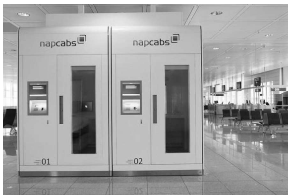
Рис. 4. Бокси Narcabs – Ментал, аеропорт м. Мюнхена