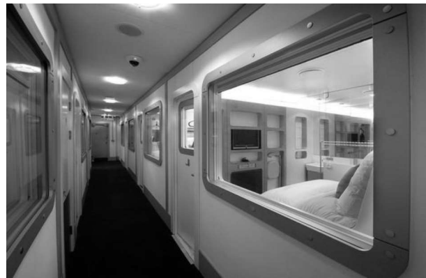
Рис. 5. Готель Yotel, аеропорт м. Хітроу

Бокси такого розміру розміщують окремо або групами в різних зонах терміналу (рис. 2, рис. 3). Компанія з Yotel додала до мінімуму пропонуємих послуг телевізор, wi-fi і душову кабінку в стандартній комплектації, а в преміум-кабінці – двоспальне ліжко. Площа встановлених в Хітроу, Гетвік (Лондон) і Схіпхол (Амстердам) боксів Yotel коливається від 10 до 15 кв. м. (рис. 5). По суті, це готель, що відрізняється від звичайного тільки своїми розмірами і портативністю.