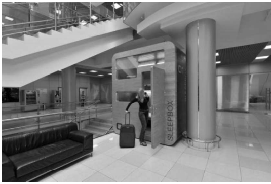
Рис. 2. Sleepbox, Росія, аеропорт Шереметьєво м. Москва