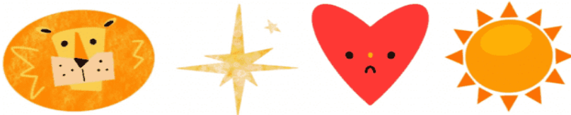
Рис. 3. Адаптація символів карт Таро в декоративні елементи одягу для дівчат молодшої шкільної групи

Карта «Мечі 3» говорить про переживання та сум, що зображені у вигляді пронизаного мечами серця, навколо якого йде дощ [2]. Інтегрувати рисунок карти в дитячому одязі запропоновано у вигляді конструктивно-декоративних кишень у формі серця, стилізованого під мінімалістичні емоджі (рис. 3).