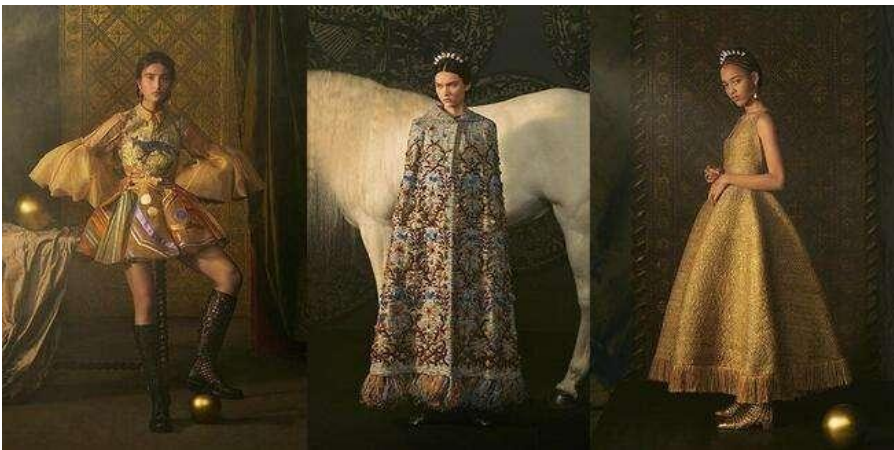
Рис. 2. Весняна колекція haute couture «Le Château du Tarot» модного дому «Dior» (2021) [1]

Символіка Таро давно використовується в різних сферах дизайну. Сучасні художники надихалися при створенні ілюстрацій сучасного мистецтва, постерів та брендингу. Наприклад, видавництво Taschen перевидало колоду карт Таро, створену Сальвадором Далі. Всесвітньо відомі Модні будинки використовували елементи Таро, як джерело натхнення у своїх колекціях костюма. Весняна колекція haute couture від креативної директорки «Dior» Марії Грації К'юрі 2021 року була нав'яна мистецтвом пророкування (рис. 2), колодою Таро XV століття, що її розробили для герцога Міланського з використанням палітри пилових відтінків коштовностей і старого золота [1].