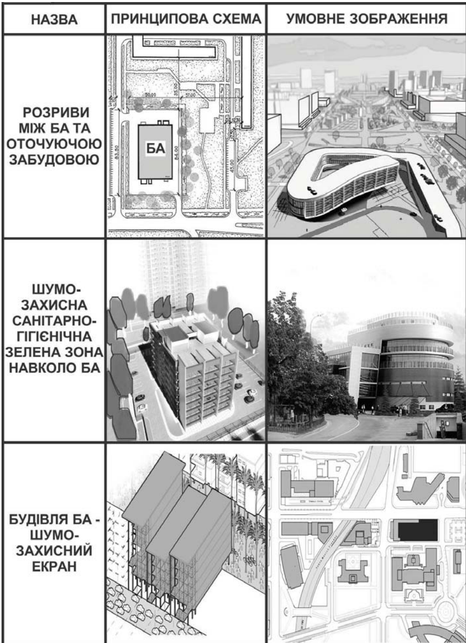
Рис. 1. 2. Засоби екологічної організації архітектурного середовища БА містобудівний рівень