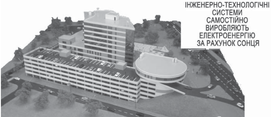
Рис. 1. 3. Багатофункціональний комплекс (БА, автосалон, офіс, магазини), м.Мінськ, 2010-2014 рр.

Прикладом впровадження альтернативних джерел енергії можна назвати багатофункціональний комплекс (автосалон, офіси, магазини, БА) – запроєктований із системами, що самостійно виробляють електроенергію за рахунок використання альтернативних джерел – сонця, землі і т.д. у м. Мінську 2010-2014 рр. будівництва (рис.1.3).