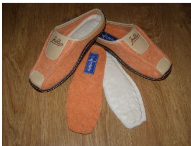
Рис. 2. Домашнє взуття зі змінними вкладними акупресурними устілками.

Після отриманого позитивного висновку ДУ «Інститута геронтології НАМН України ім. акад. Д.Ф. Чеботарьова» на сумісному українсько-італійському підприємстві «Риф-1» для реалізації споживачам виготовлено дослідну партію взуття зі змінними вкладними акупресурними устілками.