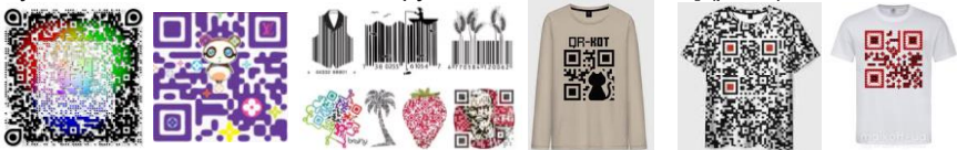
Рис. 1. Приклади нестандартних QR-кодів

Сьогодні саме персоналізація є ключовою позицією в брендингу в дизайні. Нестандартні естетичні QR-коди вважаються однією з останніх технологічних розробок, які широко використовуються як цифровий інструмент для утримання та залучення споживачів певного сектору модного продукту [3, 6] (рис. 1).