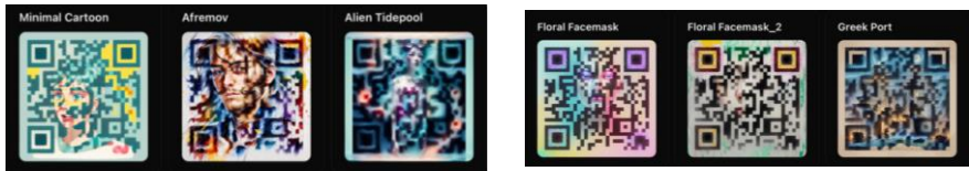
Рис. 2. Приклади варіантів згенерованих QR-кодів у Barcode

Наприклад, Barcode – сучасний генератор стилізованих QR-кодів [6], не тільки автоматично генерує QR-коди, але й оформлює їх відповідно вибраних стилів та текстових підказок, що дозволяє в одному інструменті закрити одночасно як технічну, так і візуальну складову процесу.