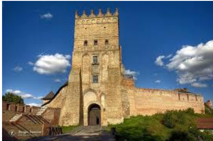
Рис. 3.4. Луцький замок

- Луцький замок: Почніть свою подорож з відвідування історичного замку в Луцьку. Це одна з найвідоміших пам'яток Волині.