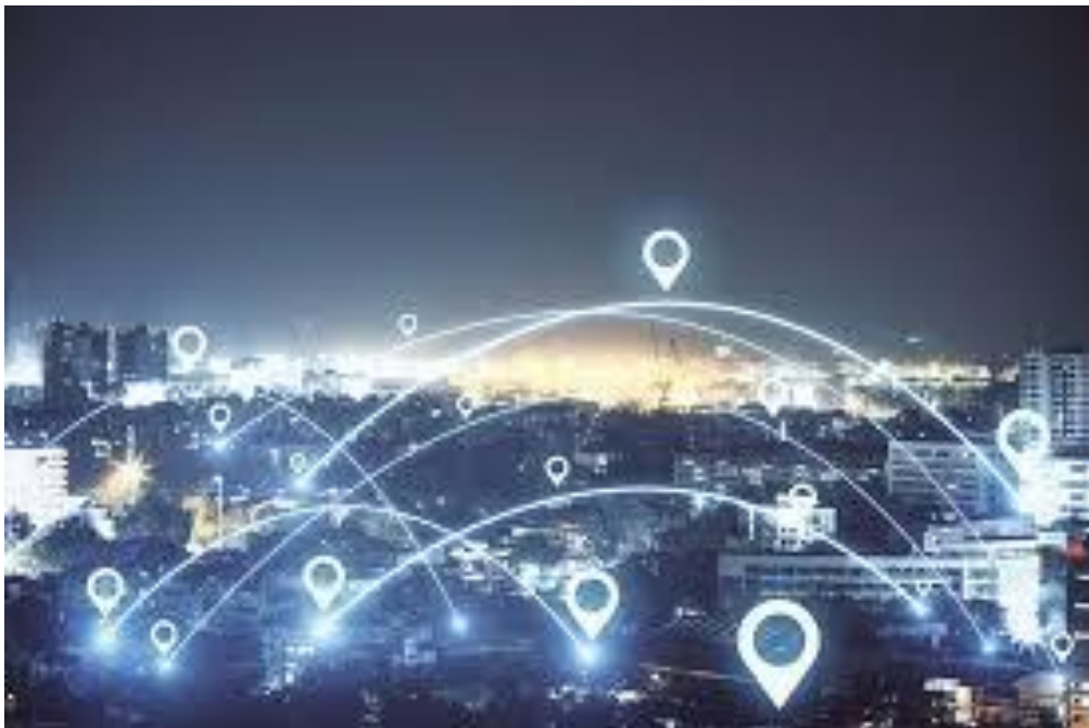
Рис. 2.2. Геолокаційні технології

Геолокаційні технології дозволяють туристам орієнтуватися у незнайомих місцях, знаходити безпечні маршрути та отримувати підтримку в разі необхідності. Вони також допомагають туристичним компаніям контролювати пересування груп туристів та реагувати на надзвичайні ситуації.