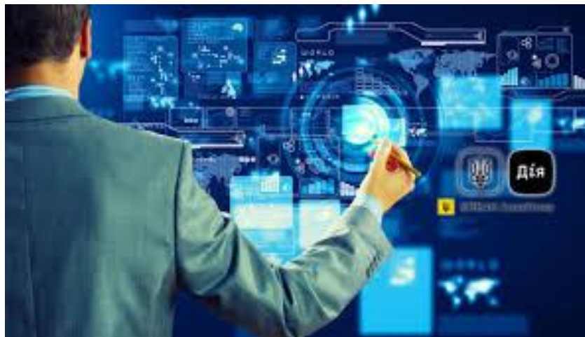
Рис. 3.6. Використання сучасних технологій

- Використання сучасних технологій, таких як програми для відстеження GPS, бази даних для зберігання інформації та аналітичні інструменти, щоб швидко отримувати необхідні дані про маршрути та подорожі.