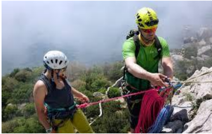
Рис. 3.1. Збирання на гору

– аналітичного (аналізу змісту документації: паспорта траси, медичного журналу огляду туристів, які виходять на маршрут, інших документів, узагальнень результатів усіх інших обстежень).