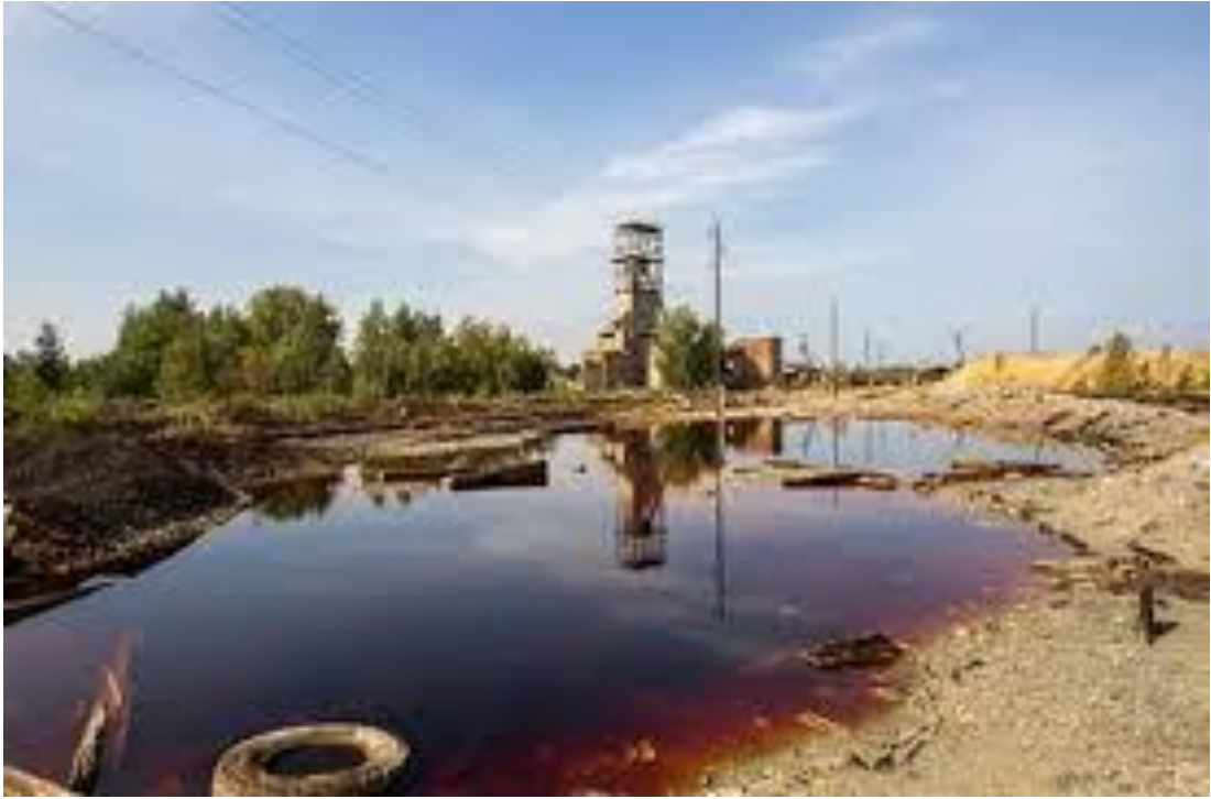
Рис. 1.4. Забруднення вод