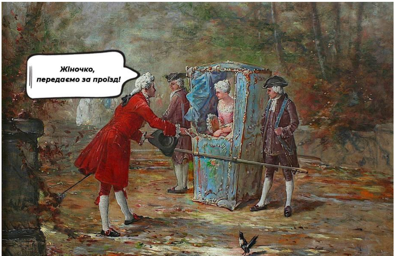
Рис. 1.2. Передача за проїзд

Характер подорожей на першому етапі розвитку був здебільшого стихійним і вимушеним. Види подорожей на цьому етапі можна класифікувати за засобами пересування: пішохідні мандрівки; з використанням водних транспортних засобів; з використанням тварин. Другий етап розвитку туризму характеризується появою перших туристичних організацій [14; 15; 16]. Одним з перших, хто здійснив організовану подорож для великої кількості людей, був англієць Томас Кук. У 1841 р. він, будучи Головою товариства тверезості, організував подорож для членів цього товариства з Лейстера в Лафборо.