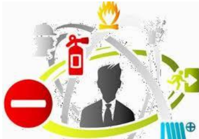
Рис. 1.3. Екологічні загрози та ризики

- Недостатня медична допомога: неадекватна медична допомога, відсутність ліків, недостатня кількість медичних закладів та інфраструктури, що може ускладнити отримання кваліфікованої медичної допомоги у разі потреби [27; 28; 29].