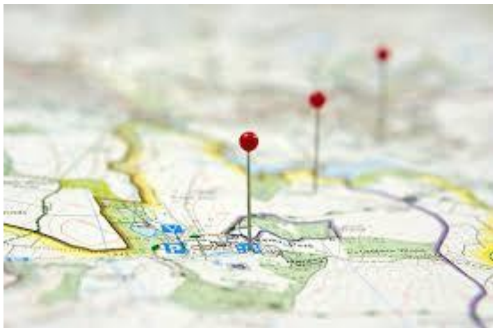
Рис. 1.7. Маршрут

2. Планування маршруту: Маршрут подорожі повинен бути розроблений таким чином, щоб клієнти отримали максимальне задоволення від подорожі. Маршрут має враховувати цікаві місця, визначні пам'ятки, зручності та можливості для відпочинку [60; 61; 62].