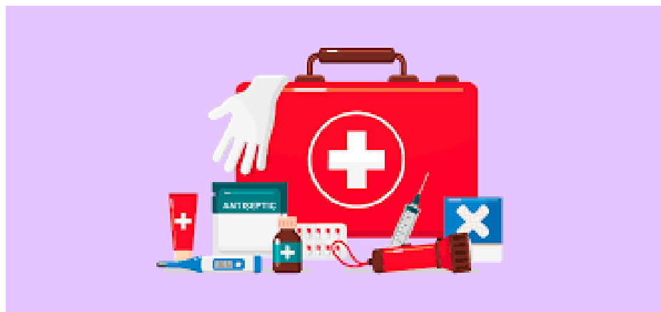
Рис. 3.2. Перша допомога

Навички першої допомоги: Кілька членів групи повинні мати базові знання з надання першої допомоги.