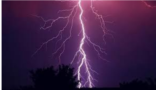
Рис. 3.3 Блискавка

- Природні ризики: Це може включати непередбачувані погодні умови (грози, зливи), лісові пожежі, повені, а також потенційну небезпеку від диких тварин.