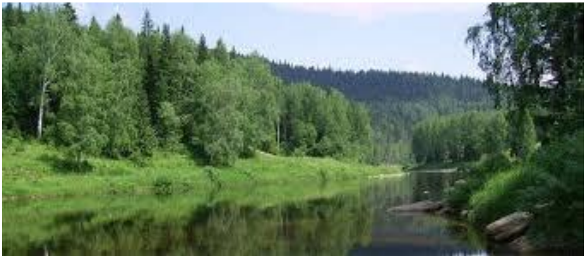
Рис. 2.3. Природні умови

- Природні умови: Географічні особливості, погодні умови та стан ландшафту впливають на безпеку туристичних маршрутів. Наприклад, погодні явища, такі як зливи або зсуви, можуть призвести до небезпеки для туристів.