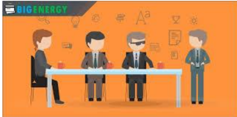
Рис. 3.7. Підвищення кваліфікації персоналу

- Навчання може включати навички надання першої допомоги, навігації, екологічної безпеки тощо.