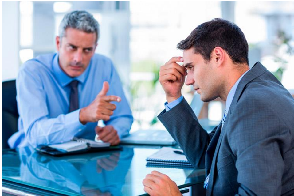
Рис. 1.6. Вивчення інтересів клієнта

2. Планування маршруту: Маршрут подорожі повинен бути розроблений таким чином, щоб клієнти отримали максимальне задоволення від подорожі. Маршрут має враховувати цікаві місця, визначні пам'ятки, зручності та можливості для відпочинку [60; 61; 62].