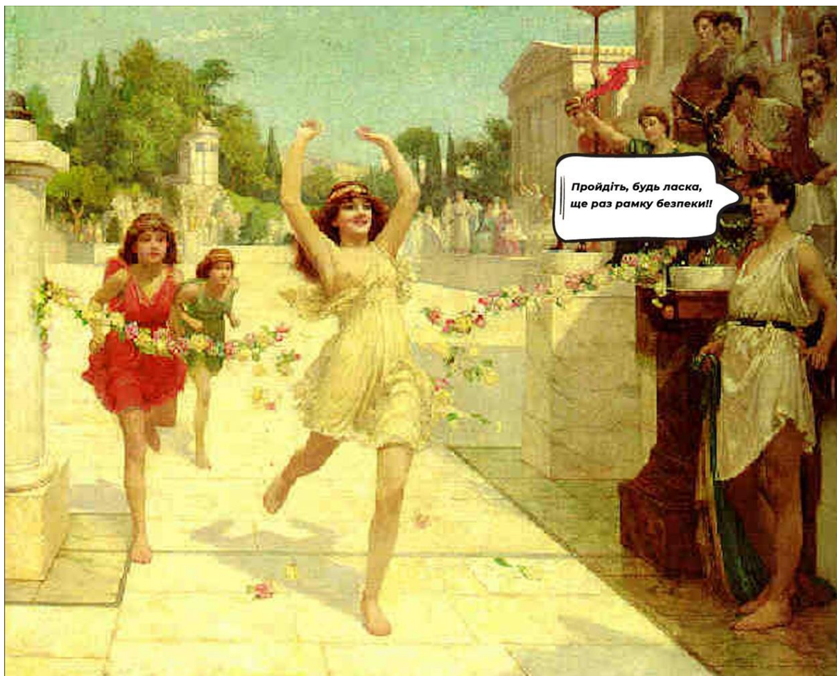
Рис. 1.1. Історія розвитку туризму та безпеки подорожей