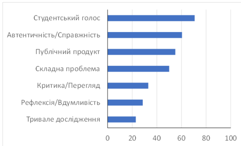
Рис. 1 Успішність опанування окремими елементами дизайн-проєкту (%) за результатами дослідження (Гапон-Байда, Деркач, 2023)

займають останні місця у рейтингу. Частка студентів, що зрозуміли сутність та значення перерахованих елементів, у всіх випадках не перевищувала 50%.