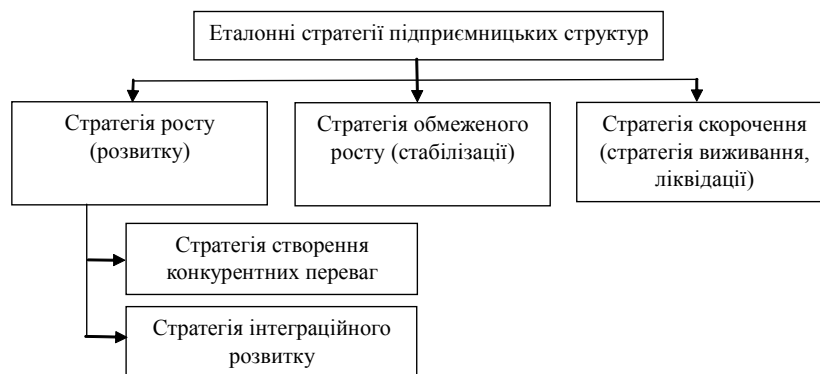
Рис. 1. Види еталонних стратегій підприємницьких структур