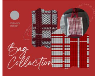
Рис. 2. Авторська сумка шопер

Висновок. Художньо-колористичне оформлення текстильних сумок відіграє важливу роль у створенні ефектної та привабливої продукції.