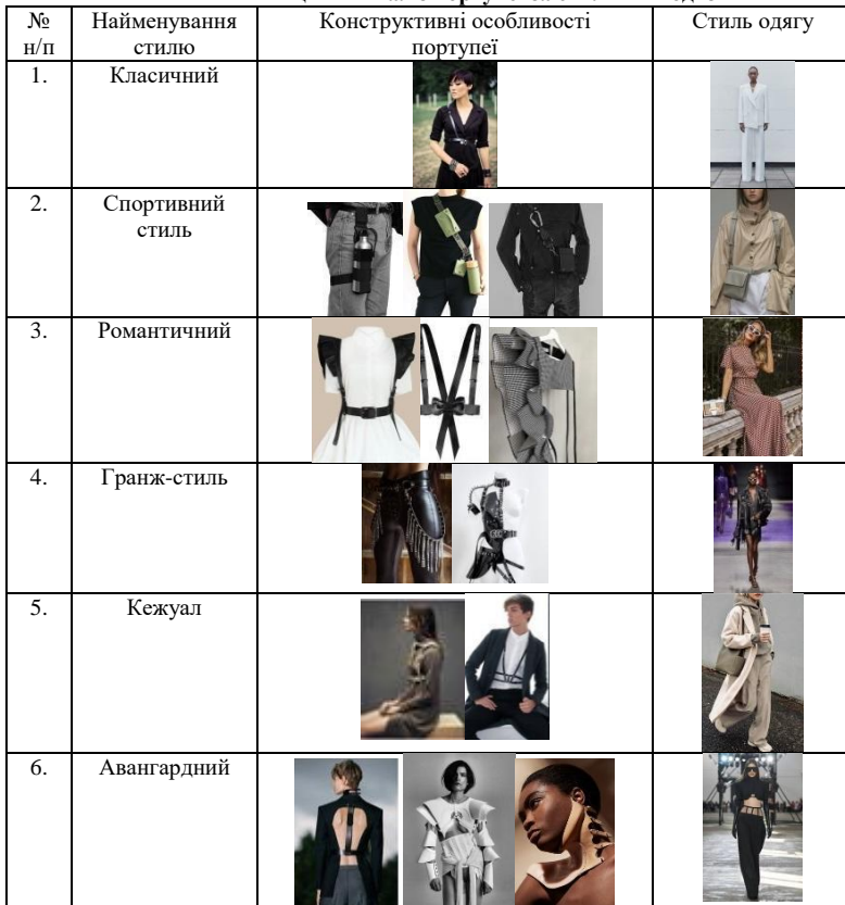
Таблиця 1 – Аналіз портупеї за стилями в одязі

Для даного стилю запропоновано портупеї декількох варіантів: вироби, що мають конструкцію з плечових ременів, виконаних у вигляді воланів або рюшів, які фіксуюватимуться до ременя на талії; вироби з плечових ременів прямої форми та на лінії талії розміщуватимуться деталі у вигляді бантів або з'ємних басок; передня пілочка виробу виконана в овальній або заокругленій формі яка підкреслює лінію грудної клітини та фіксується до лінії талії.