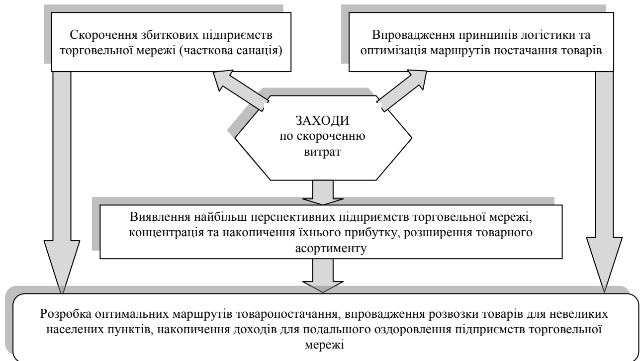
Рис. 2. Схема заходів щодо скорочення витрат підприємств торговельних мереж (авторська розробка)

Для формування додаткових джерел прибутку, скорочення витрат на здійснення торговельної діяльності відповідно до стратегії виживання торговельного підприємства необхідно переглянути функціональність торговельних мереж та здійснити заходи, запропоновані в схемі на рис. 2.