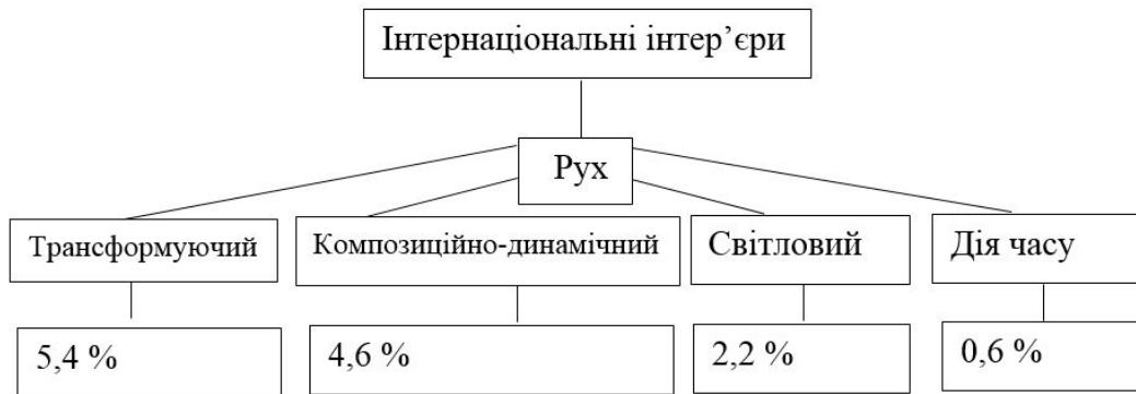
Рис.4. Прояви руху в інтернаціональних інтер'єрах

Дослідження інтернаціональних інтер'єрів дало такі процентні показники. Дія часу використовувалася дуже рідко (0,6 %). Світловий рух зарубіжні дизайнери використовують частіше (2,2 %) через інше світосприйняття та різноплановість сфери дизайну. Інтер'єрів з трансформуючим рухом так само більше (5,4%). Композиційно-динамічний рух проявився у 4,6% (Рис.4).