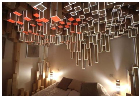
Au Vieux Panier. Архітектурна студія AVExciters, Марсель.2012