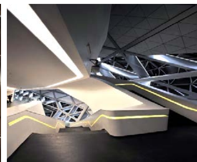
Zaha Hadid. Guangzhou Opera House, Китай. 2010