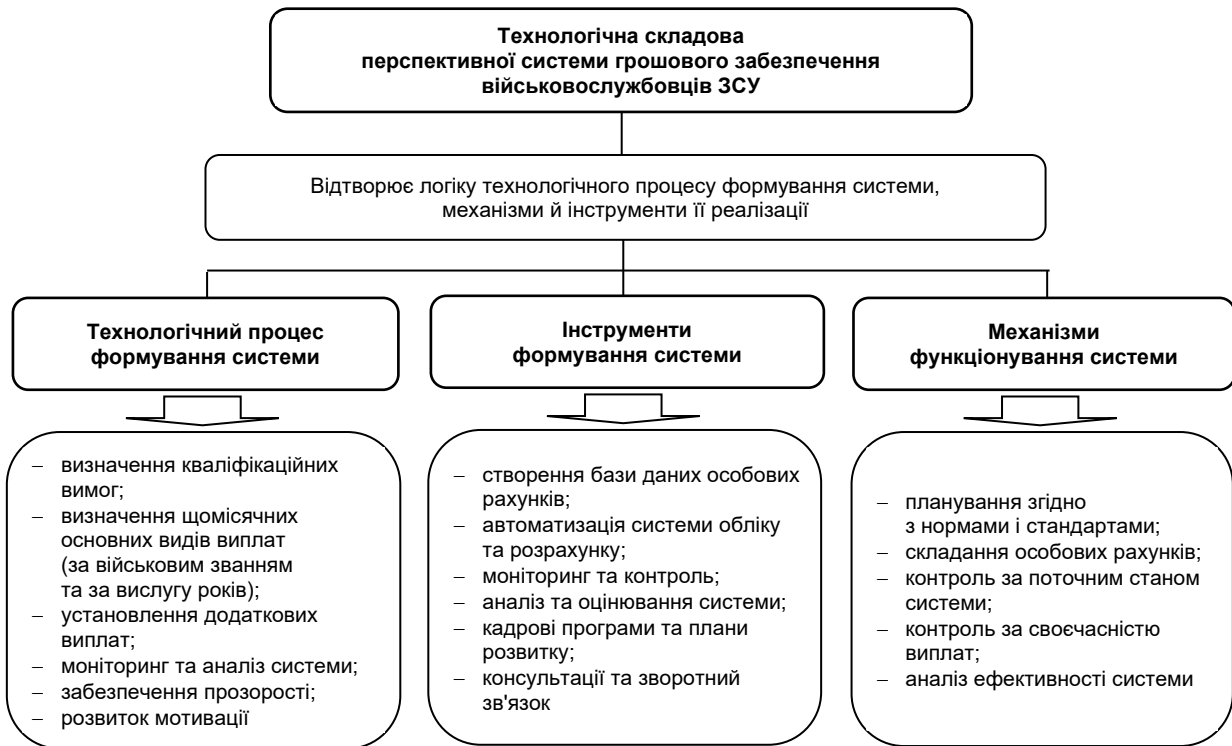
Рис. 5. Технологічна складова перспективної системи грошового забезпечення військовослужбовців ЗСУ

Комбінація цих інструментів і методів може забезпечити ефективну і справедливую систему грошового забезпечення військовослужбовців.