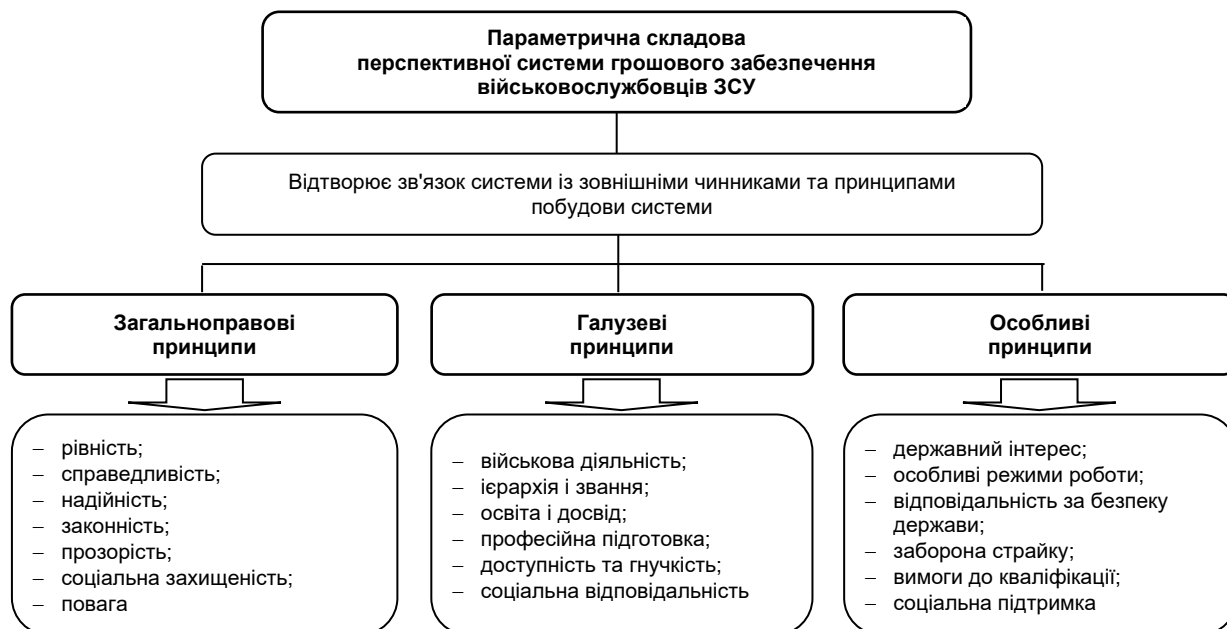
Рис. 2. Параметрична складова перспективної системи грошового забезпечення військовослужбовців ЗСУ