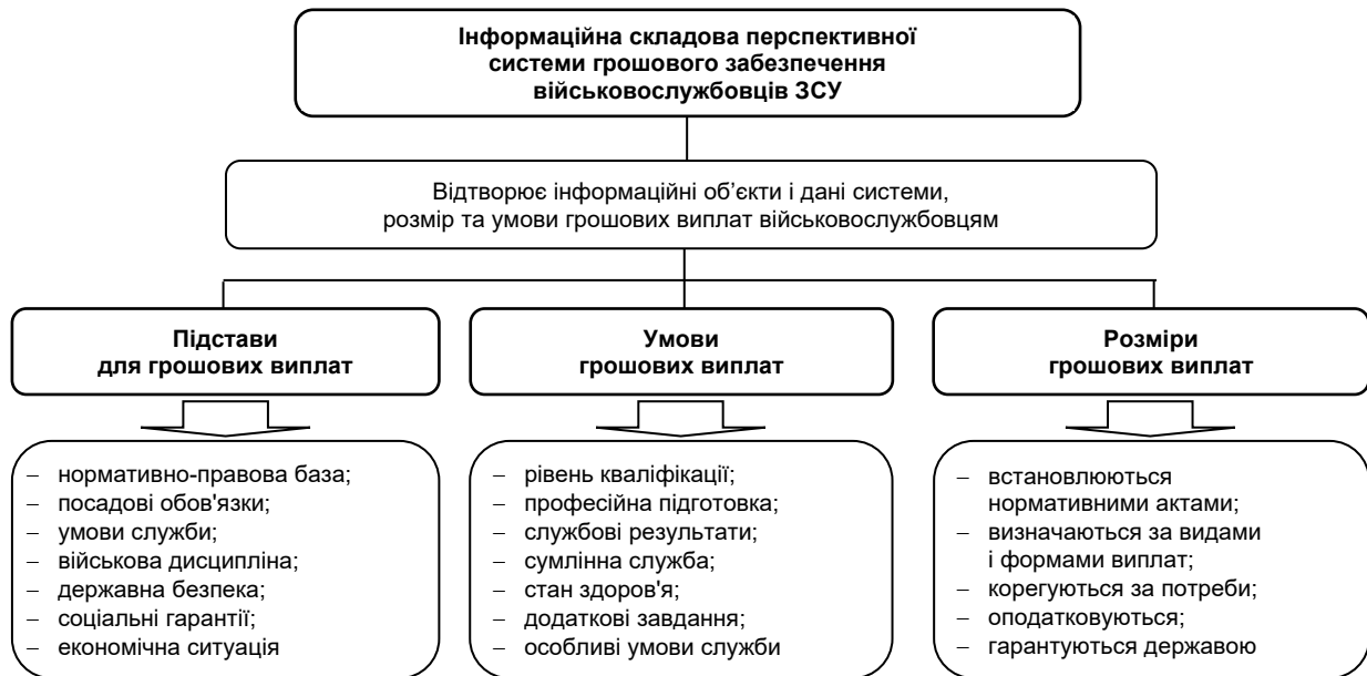
Рис. 3. Інформаційна складова перспективної системи грошового забезпечення військовослужбовців ЗСУ