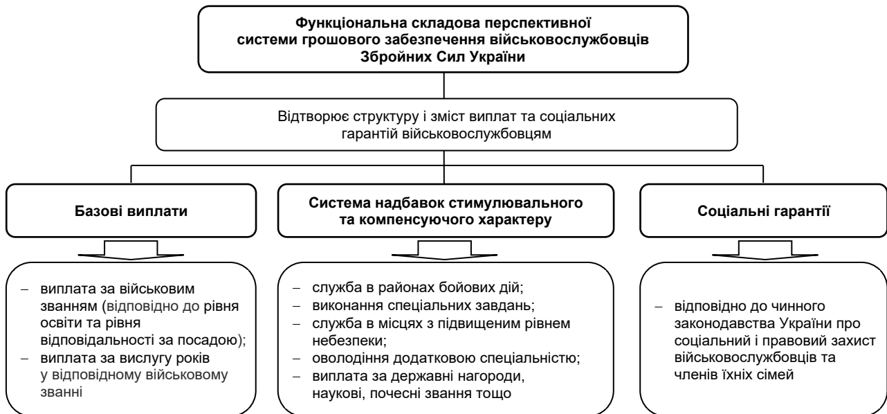
Рис. 4. Функціональна складова перспективної системи грошового забезпечення військовослужбовців ЗСУ