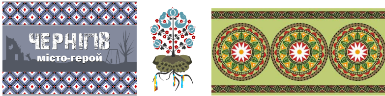
Рис. 2. Розробка векторних ілюстрацій на основі етнічних мотивів Чернігівщини