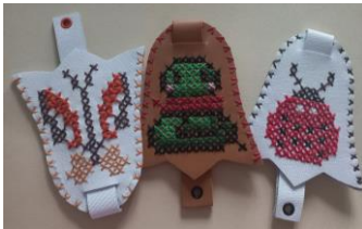
Зооморфні мотиви (вишиті)