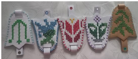
Рослинні мотиви (вишиті)