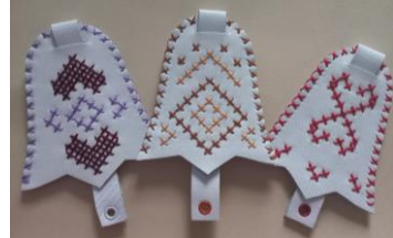
Геометричні мотиви (вишиті)