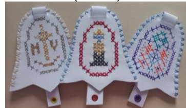
Великодні мотиви (вишиті та мальовані)