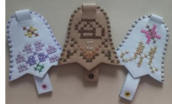
Поєднані причини і індивідуальні (вишиті)