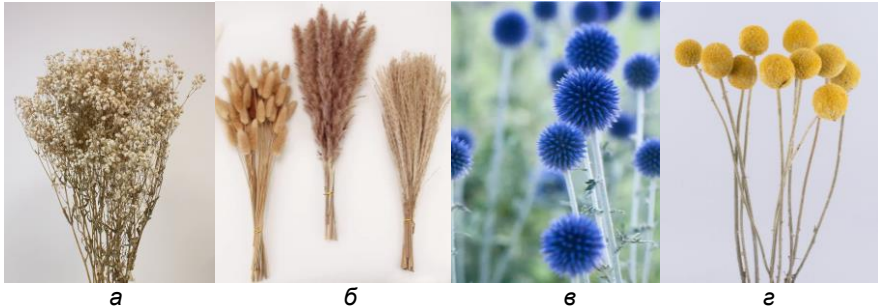
Рис.1. Приклади польових сухоцвітів:

Звертаючись до природи, варто відокремити групу польових сухоцвітів. Це висушені квіти і трави, що не втратили своєї краси, а мовби «завмерли». Теоретично, будь яка квітуча рослина може вважатися сухоцвітом, проте флористи вважають, що не всі види рослин здатні зберегти цілісний та естетичний вигляд після висушування. Однією з характерних рис рослин-сухоцвітів є наявність суцвіття, тобто стебла з багатьма квітами, що наче маленькі модулі об'єднуються у довершену ритмічну композицію (рис.1).