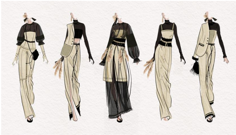
Рис. 3. Ескізи авторської колекції жіночого одягу «Присутність тиші»

На основі аналізу творчого джерела розроблено ескізний проект авторської колекції одягу «Присутність тиші» (рис. 3). Силуети виробів колекції витягнуті, наче стебла сухоцвітів. Композиційне рішення моделей побудоване на поєднанні бежевого кольору (колір сухоцвітів) та чорного кольору (контрастне тло, що асоціюється із землею).