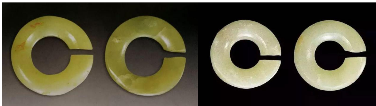
Рис. 1. Виріб з нефриту «Юцзюе», автор невідомий, династія Сінлонгва, Китай, VII тис. до н. е.

який може представляти характеристики різних культурних моделей. Плоска поверхня, поверхня ямки, плоска опуклість, прихований підйом, виступ, виїмка та інші техніки були використані автором ще в добу середнього неоліту, що свідчить про високі естетичні вподобання та високий інтелектуальний розвиток тогочасної спільноти. Багато дослідників стверджують, що саме нефритова культура Лянчжу не має собі рівних серед інших культур в епоху неоліту.