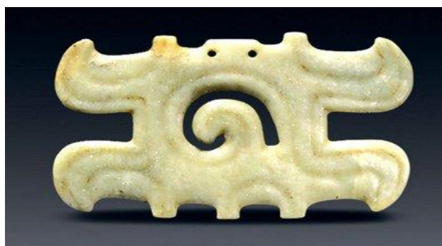
Рис. 3. Виріб із нефриту у вигляді хмари, династія Хуньшань, Китай, VI ст. до н. е.