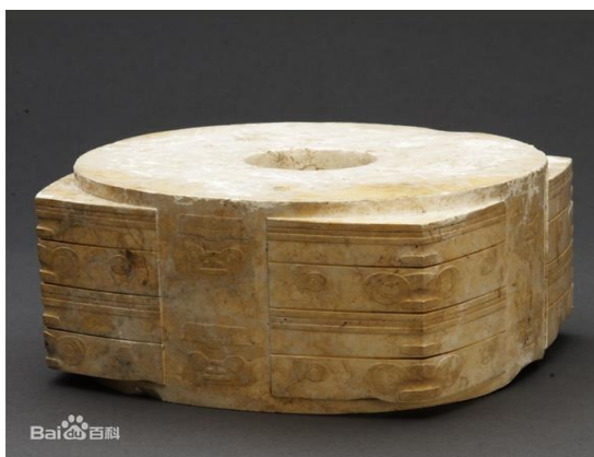
а) виріб з нефриту “Конг”, династія Лянчжу, північ Китаю, IX ст. до н. е.