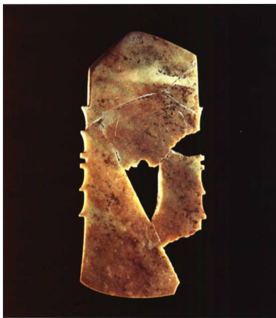
Рис. 5. Виріб з нефриту “Ци”, династія Ін, Китай, IX ст. до н. е.

жаби, черепахи, цикади, богомоли, бамбукові палички, браслети, ручки, підвіски, круглі намистини, обручі, смужки для пірсингу, орнаменти, орнаменти – довгі смужки, орнаменти у формі півмісяця” [3, ст. 34].