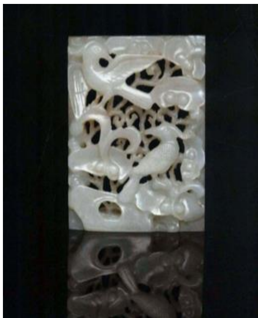
Рис. 7. Виріб з нефриту (поясна прикраса), династія Цінь, Китай, III ст. до н. е.