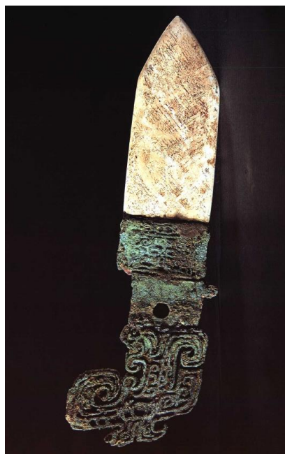
Рис. 6. Нефритовий кинжал “Ге” (бронзове руків’я зображає дракона, оздоблене бронзою), династія Цінь, Китай, III ст. до н. е.