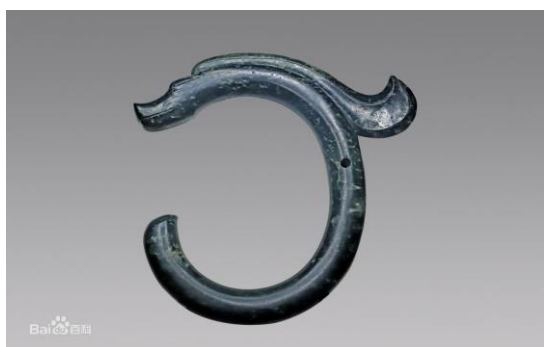
Рис. 2. Виріб з нефриту “Югоулонг”, династія Хуньшань, Китай, IX ст. до н. е.