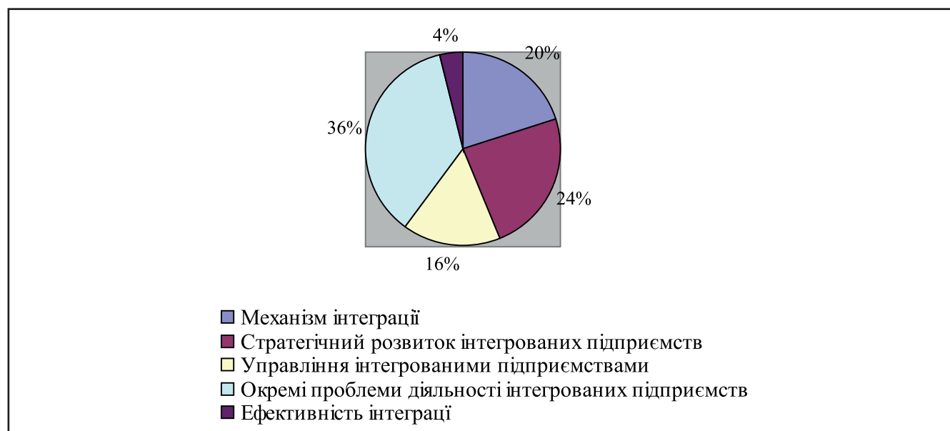
Рисунок 3. Структура тематичних проблем дисертаційних досліджень за напрямом «інтеграція підприємств та формування підприємницьких структур» за період 2000–2020 роки

Найбільшими науковими центрами з питань інтеграції підприємств та формування підприємницьких структур є НААН України, ННЦ «Інститут аграрної економіки» м. Київ (15,0%), Харківський національний економічний університет (13,0%), Національний аграрний університет м. Київ та Одеський державний економічний університет по 8,0%, Київський національний торгово-економічний університет, Хмельницький національний університет та Інститут економіки промисловості НАН України, м. Донецьк по 5,0%.