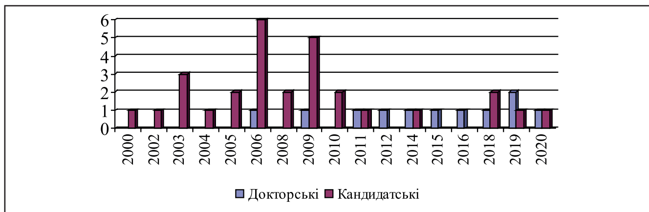
Рисунок 1. Динаміка кількості дисертацій за напрямом «інтеграція підприємств та формування підприємницьких структур» за період 2000–2020 роки

Поштовхом до дослідження цієї проблематики став перехід України до ринкових умов господарювання, надання підприємствам самостійності діяльності, їх вихід на світові ринки. Починаючи з 2006 року дана проблематика набула підвищеного інтересу науковців. В останні роки спостерігається тенденція щодо зростання кількості захищених докторських дисертацій, всього за період 2000–2020 рр. захищено 11 докторських дисертацій, з них – 5 (45,0 %) за останні чотири роки. У своїх дослідженнях науковці роз-