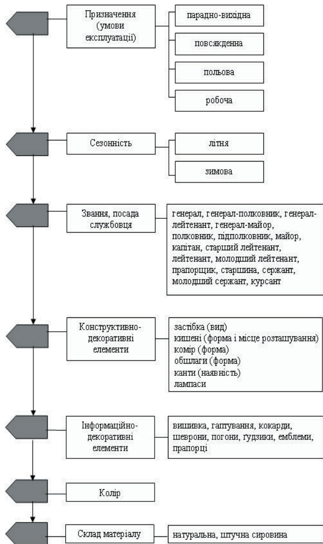
Рис. 2. Структурно-логічна модель процесу проектування форменого одягу

У пропонованій методиці також приведено структурно-логічну модель процесу проектування форменого одягу (рис. 2). Така модель процесу проектування форменого одягу передбачає чіткий взаємозв'язок між призначенням форменого одягу і сезонністю його використання. Особливе місце в структурно-логічній моделі приділено вибору КДЕ і ІДЕ, колірному рішенню костюма в залежності від посади службовця. Також у моделі передбачено вибір місця розташування ІДЕ, колірному рішенню і складу матеріалу.