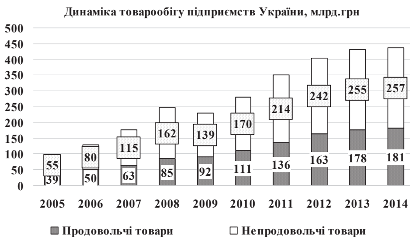
Рис. 2. Динаміка роздрібного товарообороту підприємств України за 2005–2014 рр. з розподілом за продовольчими та непродовольчими товарами

У 2014—2015 роках на ринку організованої роздрібної торгівлі України спостерігалось збереження позицій найбільших ритейлерів у сфері торгівлі продовольчими товарами. Основні зусилля операторів були спрямовані на утримання ринкових позицій, опти-