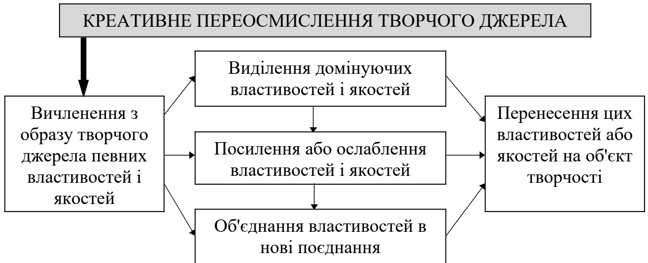
Рис. 2. Послідовність трансформації творчого джерела у костюмні форми

Ідеї колекції одягу можна розробляти у напрямі пошуку форми, фактури, кольору тощо, що мають оригінальність і новизну. При використанні творів архітектури для пошуку нової форми одягу зазвичай використовують асоціативний зв'язок форми з творчим джерелом. У сучасному костюмі використовують не прямі аналогії з архітектурою, а образні асоціації, що