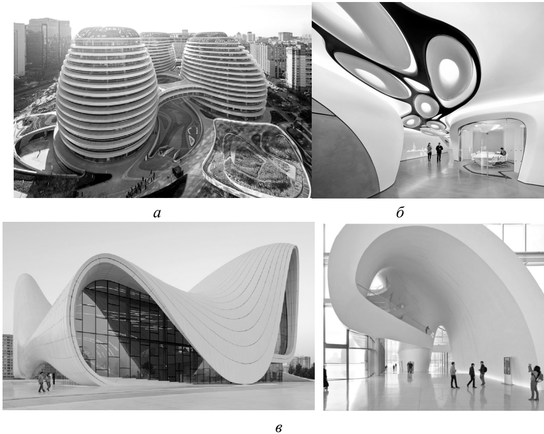
Рис. 1. Архітектурні споруди Zaha Hadid Architects