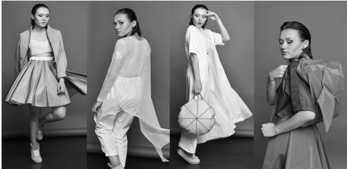
Рис. 6. Моделі колекції Amanita Muscaria

Деякі моделі колекції містять елементи трансформації: куртка трансформується в рюкзак; капюшон жилету пристібається до горловини спинки; сукня трансформується за рахунок передньої частини, що розстібається; деякі речі можна носити з обох сторін. В колекції використано тканини з принтами, а також аплікацію та оздоблення яскравою тасьмою (рис.6).