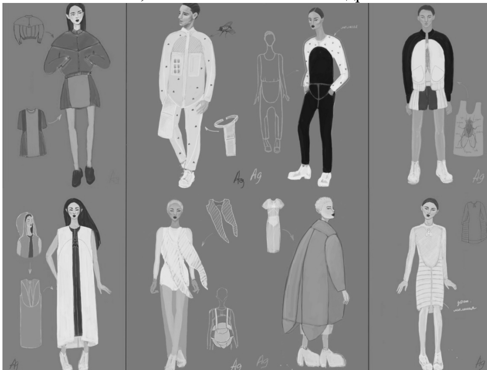
Рис. 5. Ескізи колекції Amanita Muscaria , створеної на основі творчості архітектора Захи Хадід

Для виготовлення моделей колекції використано матеріали: сатин-котон білого та сірого кольорів, плащові тканини білого, сірого та лимонного кольорів, органза, сітка, трикотажне полотно; застібки-блискавки, кнопки, магніти, пластмасові баклі, пластмасові пластини та дрід.