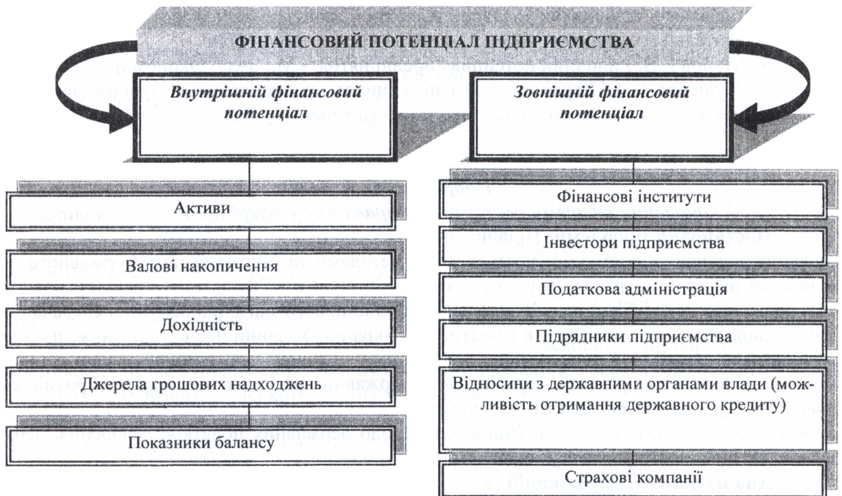
Рис.2. Фінансовий потенціал в залежності від свого розподілу на внутрішній і зовнішній.

Висновки та пропозиції подальшого розвитку. Фінансовий потенціал має особливе значення для підприємства, особливо в умовах його зростання. Але занадто швидке зростання фінансового потенціалу, зростання потужними та швидкими темпами може бути небезпечним для підприємства. Тому необхідно збалансувати прибутки, активи та зростання. При цьому для забезпеченості збалансованого зростання необхідно враховувати структуру балансу і ступінь залежності підприємства від кредиторів, дотримуватись певного рівняння (1):